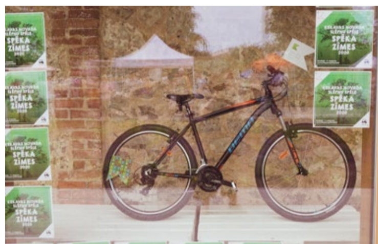
Galvenā balva - kalnu velosipēds - aplūkojama Jaunu ideju centra skatlogā.

Piedalīšanās spēlē ir bez maksas. Jāņem vērā, ka bukletu patstāvīgi drīkst aizpildīt tikai personas, kuras ir vecākas par 12 gadiem. Ja tev vēl nav 12 gadu, tevi kā dalībnieku piesaka tavs oficiālais aizbildnis, kurš aizpilda arī buk-