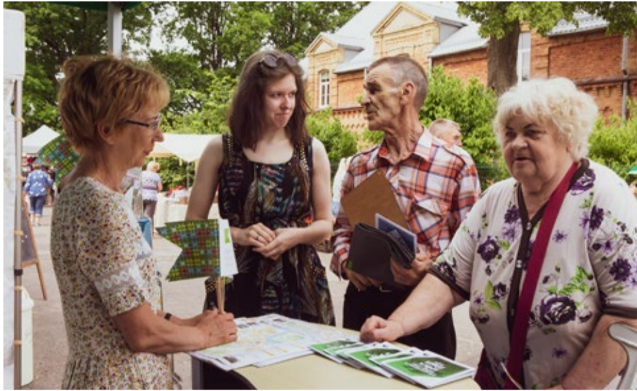
►Turpinājums no 1. lpp.

ienāk katrās mājās, jo šo pasākumu bija iespēja vērot tiešsaistē.