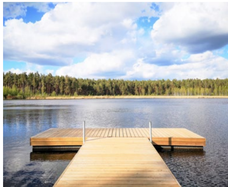
Atpūtas vieta pie Titurgas ezera.

Ķekavas novada peldvietās jūnija beigās atkārtoti veikts ūdens vizuāls novērtējums un testēti paraugi laboratorijā, kas apliecina, ka kopumā ūdens rādītāji visās vietās joprojām atbilst izcilai kvalitātei.