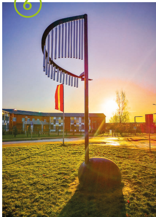
5. Vides akcija "Iestādi koku!" 6. Vides objekts pie Ķekavas mūzikas skolas 7. - 8. Svētku rotājumi gadumijā