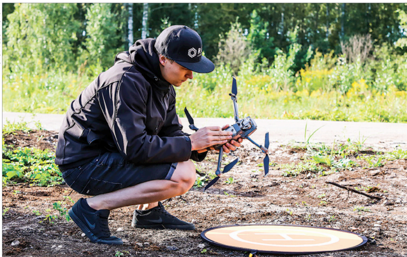
Inovatīvo tehnoloģiju uzņēmuma „DJI Latvija” pārstāvis vada apmācību Baložos.