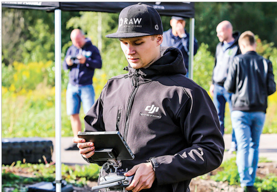
„SPH Engineering” un „DJI Latvija” pārstāvji pārstāvis vada apmācību Baložos.