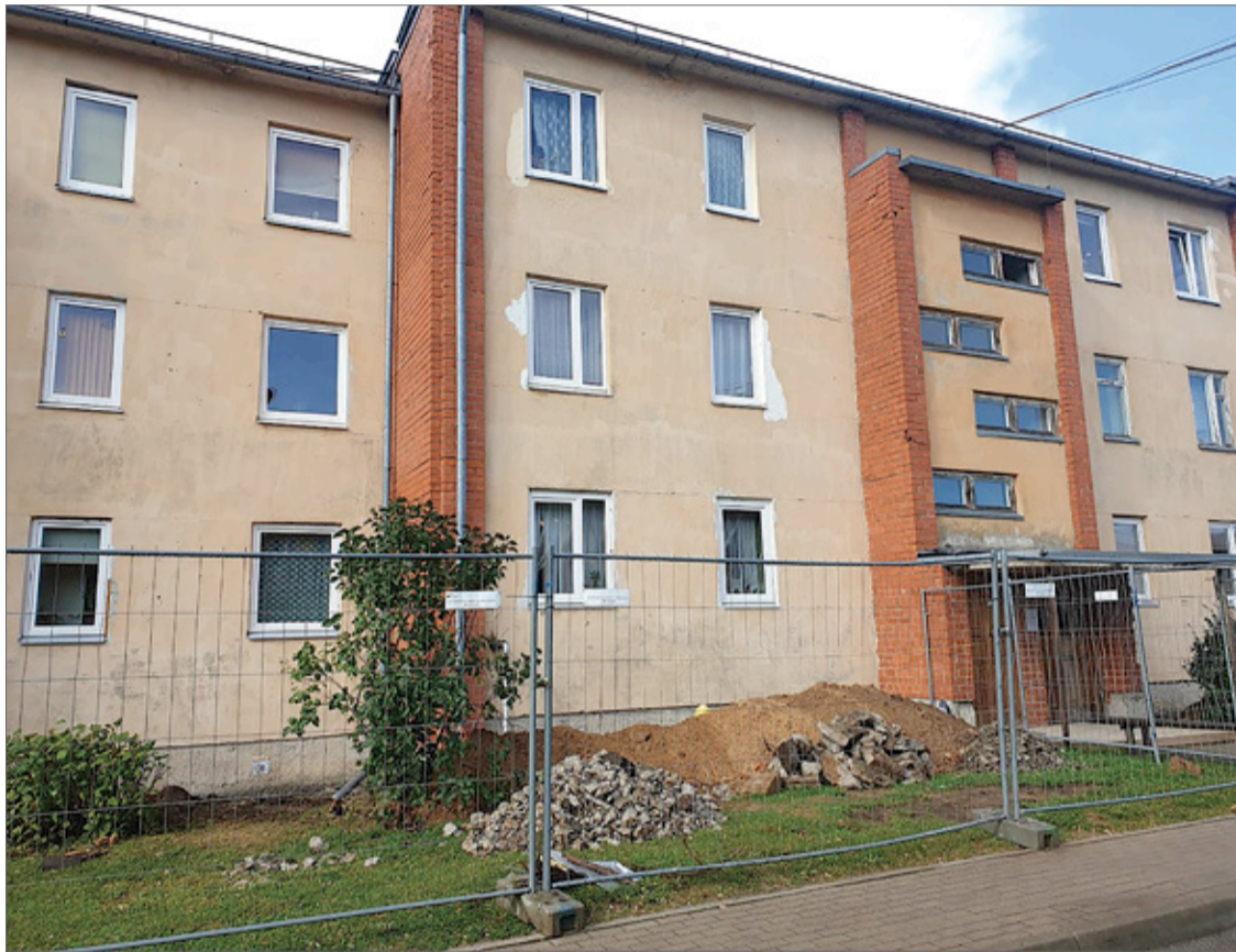
Daudzdzīvokļu dzīvojamā māja Ķekavā, Nākotnes ielā 8.

Septembrī uzsākti būvdarbi, lai paaugstinātu energoefektivitāti vēl vienai daudzdzīvokļu mājai Ķekavā – ēkai Nākotnes ielā 8.