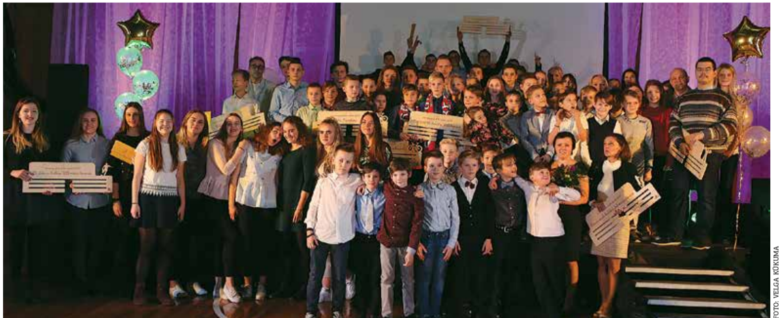
Jauniešu gada balvas sportā pasniegšanas ceremonijā.