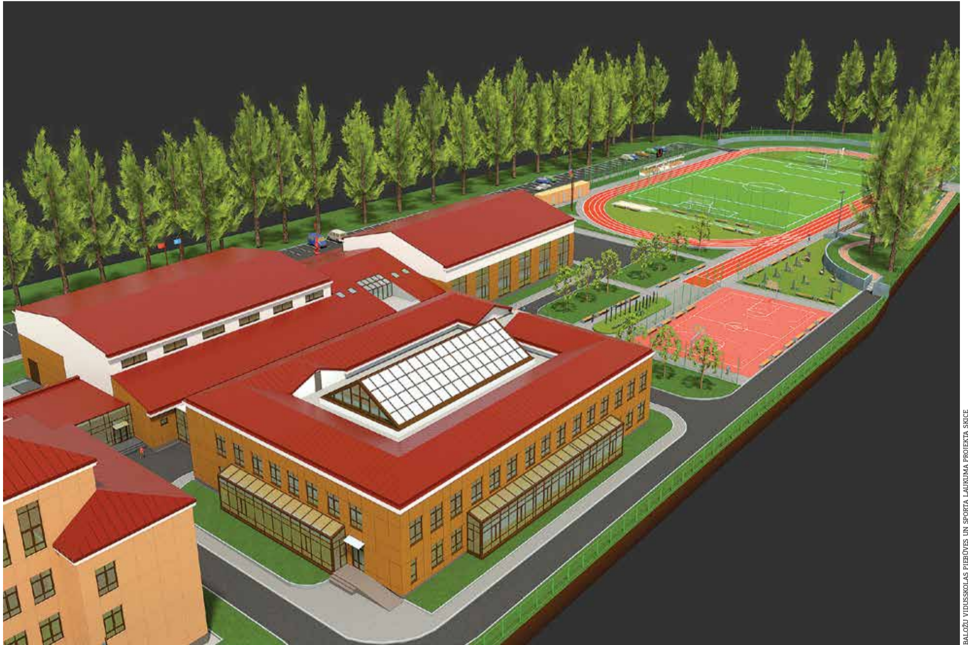
BALOŽU VIDUSSKOLAS PIEBŪVES UN SPORTA LAUKUMA PROJEKTA SKICE

Lai uzlabotu mācību vidi abās Ķekavas novada vidusskolās un atrisinātu problēmu ar mācību telpu trūkumu Baložu vidusskolā, Ķekavas novada pašvaldība īsteno aptuveni deviņus miljonus eiro vērtu izglītības infrastruktūras attīstības projektu, šogad uzsākot jaunas piebūves celtniecību un sporta laukuma pārbūvi Baložu vidusskolai.