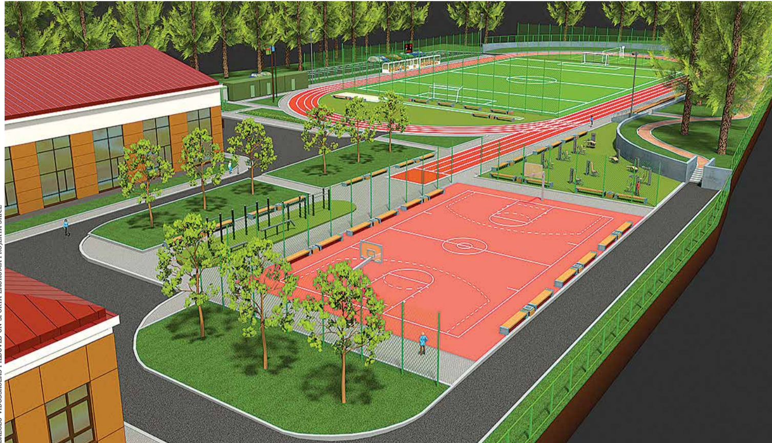
BALOŽU VIDUSSKOLAS PIEBŪVES UN SPORTA LAUKUMA PROJEKTA SKICE