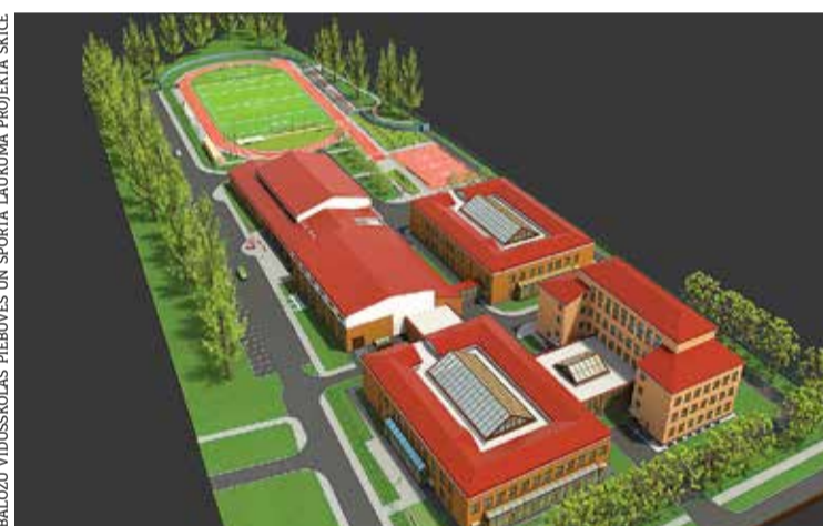
BALOŽU VIDUSSKOLAS PIEBŪVES UN SPORTA LAUKUMA PROJEKTA SKICE

Arī Ķekavas vidusskolā, modernizējot informācijas un komunikāciju tehnoloģiju jomu, tiks iegādāti pieci komplekti mobilām darba vietām ar datoru, kas sekmēs digitālo kompe-