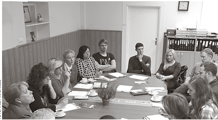
Diskutējot ar uzņēmējiem par bērnodārzu rindu samazināšanu.

Zināms, ka bērnu skaits novadā pieaug un pašvaldība savos bērnodāros spēj uzņemt tikai daļu. Taču pašvaldības pienākums ir nodrošināt ikvienu novadā deklarētu bērnu ar vienlīdzīgu iespēju iegūt izglītību, tādēļ pašvaldība deleģē pirmsskolas izglītības funkciju uzņēmējiem. Pašlaik situācija ir tāda, ka, lai mazinātu bērnu rindas, kas gaida savu kārtu uz vietu pašvaldības bērnodāros, no valsts un pašvaldības budžeta tiek finansētas vietas