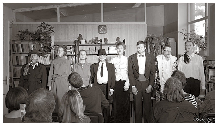
Mirkļis pēc izrādes „5 Raiņi un Aspazija”.

izrādes – 28. novembrī plks.19 Priskilla fon Fāko „Tev ir šī Pasaciņa” (režija – Estere Pumpura, mūzika – Valērijs