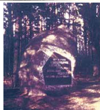
Piemiņas akmens 1. Daugavgrīvas latviešu strēlnieku bataljonam birtalā pie Spieķu kalna; 1989. gada 29. jūlijā

Padomju laikā, 1963. gadā, pēc veco latviešu strēlnieku iniciatīvas šie Brāļu kapi tika no jauna sakārtoti, uzliekot arī piemiņas plāksni ar tekstu latviešu un krievu valodā. Savukārt 1975. gada 21. augusta aktā piemiņkļu inspekcijas komisija, pārbaudot šo republikas nozīmes vēstures pieminekli, atzīmējusi: „Ķekavas ciema DDP IK lēmumā bija norādīts, ka par šefiem šiem Brāļu kapiem ir piestiprināts kolhozs „Ķekava”. Brāļu kapi pilnīgi nekopti, lielu meliorētu lauku vidū. Nācās brīst taisni pāri kolhoza lupīnas laukam, jo neviena taciņa neveda uz šo piemiņekli.” Pēc tam 1977. gadā ar Ķekavas ciema izpildkomitejas ziņu kolhozs veica simbolisku pārapbedījumu, pārvedot uz Trušeļu (sākotnēji saukti Jaunās muižas) kapiem karavīru trūdus un arī piemiņas plāksni. Taču ik rudenī un pava-