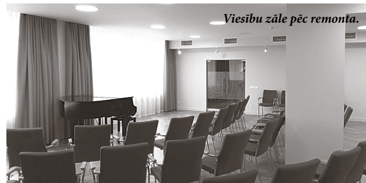
Viesību zāle pēc remonta.