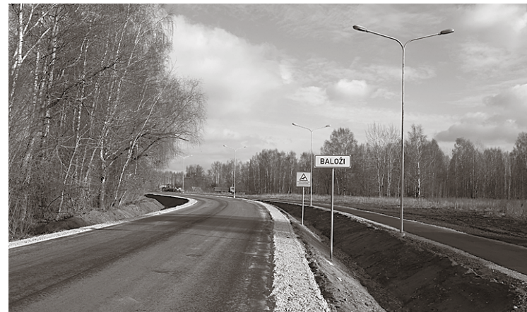
Rekonstruētā Rīgas iela.

Arī Krustkalnu iedzīvotāju ilgi gaidītā ietve no tirdzniecības centra „A7” līdz Mežmalas ielai beidzot top. Ietve detalplānojuma izstrādes laikā bija ielānāta jau 2013. gadā. Šā projekta īste-