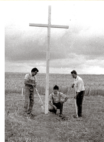
Krusta uzstādīšana Spieķu kalna Brāļu kapos 1990. gada jūlijā.

sari, apstrādājot tīrumus, Spieķu kalniņā virszemē parādījās kauli un karavīru ekipējuma fragmenti. Kad Kultūras fonda Ķekavas kopa 1989. gadā rīkoja Strēlnieku dienu un gribēja atjaunot izpostīto piemiņas vietu, vietējā vara to neļāva, bet tika rasts kompromisa variants – uzstādīt piemiņas akmeni 1. Daugavgrīvas bataljona strēlniekiem birtalā pie Spieķu kalna. Trešās atmodas kustībai pieņemoties spēkā, vara piekāpās. Kolhoza zemes ierīkotājs pēc vajadzības kartēm atzīmēja kādreizējo Brāļu kapu vietu, ar pašvaldības atbalstu tika izgatavots un uzstādīts krusts. Svinīgais pasākums notika 1990. gada 15. jūlijā. Pēc tam atjaunotā Brāļu kapu komiteja veica izrakumus, konstatējot