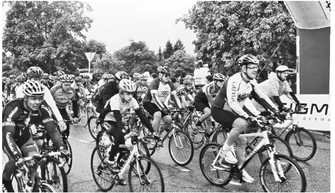
6. septembris. Vienības velobrauciens kopā ar valsts prezidentu V. Zatleru.

Pirms 20 gadiem – 1989. gada 23. augustā vairāk nekā divi miljoni Latvijas, Lietuvas un Igaunijas iedzīvotāju, sadodoties rokās, izveidoja simtiem kilometru garu dzīvu vienotības ķēdi, prasot Baltijas valstu neatkarības atjaunošanu. Atzīmējot šī unikālā notikuma gadskārtu, šogad 23. augustā notika visu trīs valstu iedzīvotāju Vienotības skrējieni „Sirdspuksti Baltijai”, atkārtojot Baltijas ceļa maršrutu.