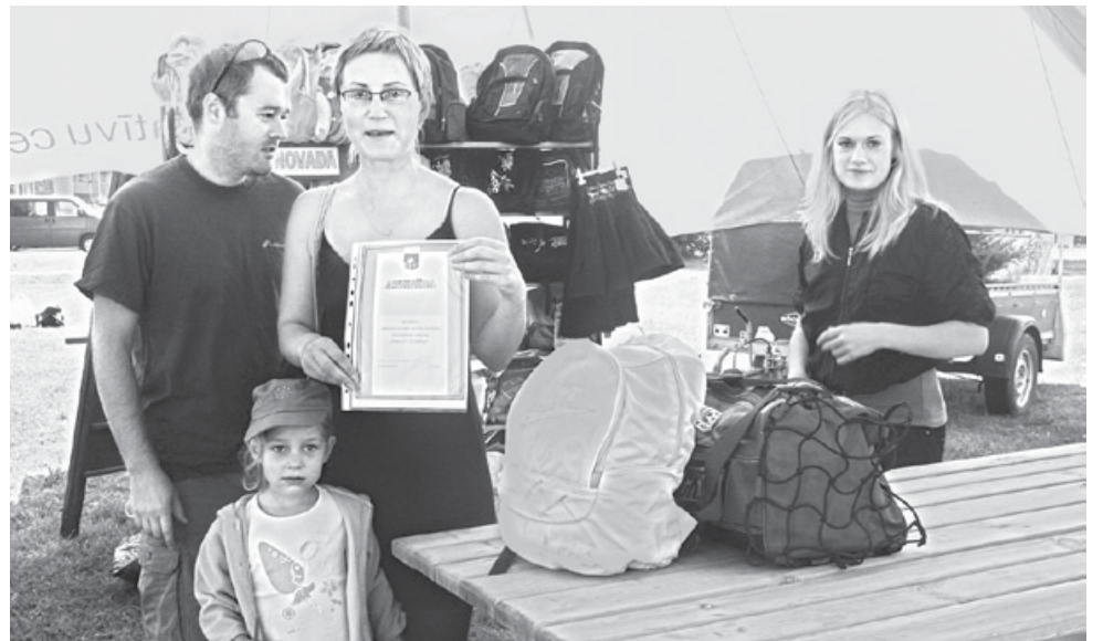
Katrs dāvinātājs saņēma Ķekavas novada domes atzinības rakstu.

Klāt ir jaunais mācību gads. Katrā ģimenē, kurā aug skolnieks, šis ir rūpju, patīkama satraukuma un prieka laiks. Skolniecīņš ir jāapgērbj, jāsagādā skolas soma, mācību līdzekļi, literatūra un daudz kas cits. Apzinot novada ģimenes, kurām ir nepieciešams atbalsts, nolēmām rast līdzcilvēkiem iespēju atbalstīt novadniekus un gūt prieku apzinoties, ka ikkatra palīdzība ir novērtēta un nepieciešama.