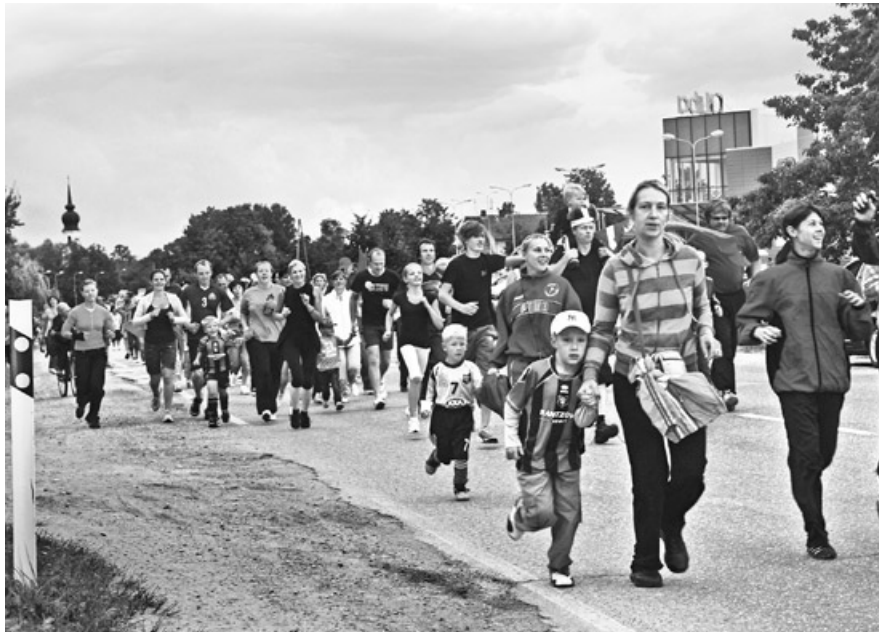
23. augusts. Vienotības skrējieni – Ķekavas centrā.