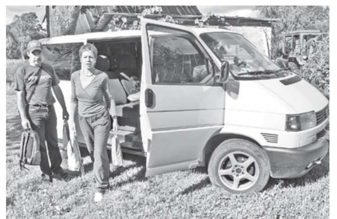
Jau nākamajā dienā sociālā dienesta autobusiņš devās ceļā pie dāvanu saņēmējiem.

Daudzi cilvēki nāca pie telts un izteica sapratni un vēlmi piedalīties šādos pasākumos atkal un, vēlams, biežāk. Katrs, kas bija kopā ar mums, saprata, ka vislielākais prieks ir dodot.