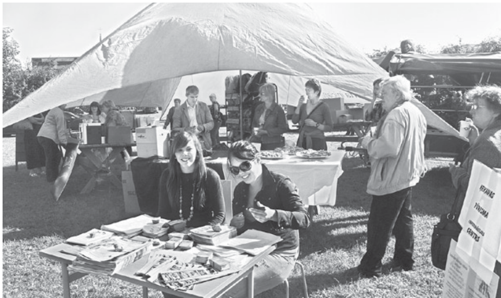
Dāvināšanas svētku telts visu dienu pulcēja daudz apmeklētāju.