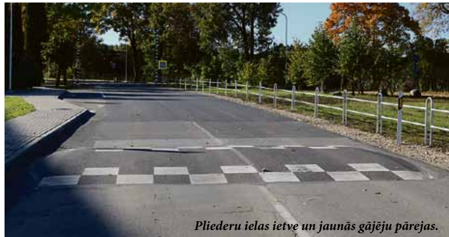
Pliedru ielas ietve un jaunās gājēju pārejas.