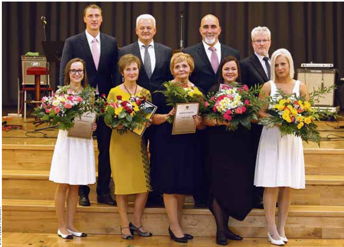
Labākie pedagogi kopā ar domes un pašvaldības pārstāvjiem.