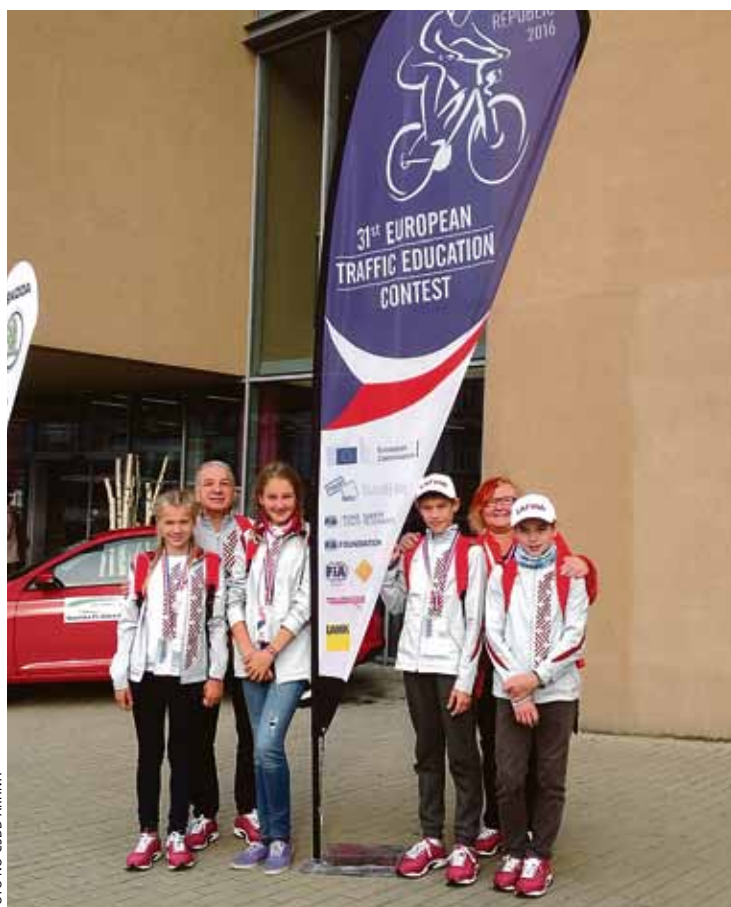
Latvijas jauno velosipēdistu izlase.

Jaunieši šovasar sasniedza visaugstākos rezultātus CSDD jauno velosipēdistu Latvijas sacensībās „Jauno satiksmes dalībnieku forums”. Līdzīgi kā jauno satiksmes dalībnieku forumā, arī starptautiskajās sacensībās galvenais uzsvārs bija likts uz divām lietām – kopīgu komandas darbu un satiksmes drošības teorētisko