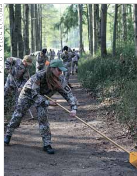
Vislielākā talkošanas vieta Ķekavas novadā bija Nāves salā.

27. aprīlī aizvadītā talka jau vienpadsmito gadu aicināja Latvijas iedzīvotājus padarīt apkārtni vidi tīrāku un pašiem patīkamāku. Ķekavas novada pašvaldība pateicas ikvie-