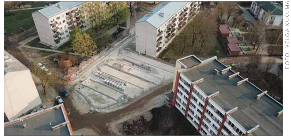
Stāvlaukuma rekonstrukcijas process.

Ķekavas novada pašvaldības Īpašuma pārvaldes speciālisti informē, ka stāvlaukuma rekonstrukcijas darbi Ķekavā, Gaismas ielā 19, tuvojas noslēguma posmam. Jau paveikti ūdensvada tīkla pārbūves darbi, tāpat izbūvēti jauni lietus ūdens kanalizācijas tīkli, kas turpmāk novērsīs peļķu veidošanos šajā teritorijā.