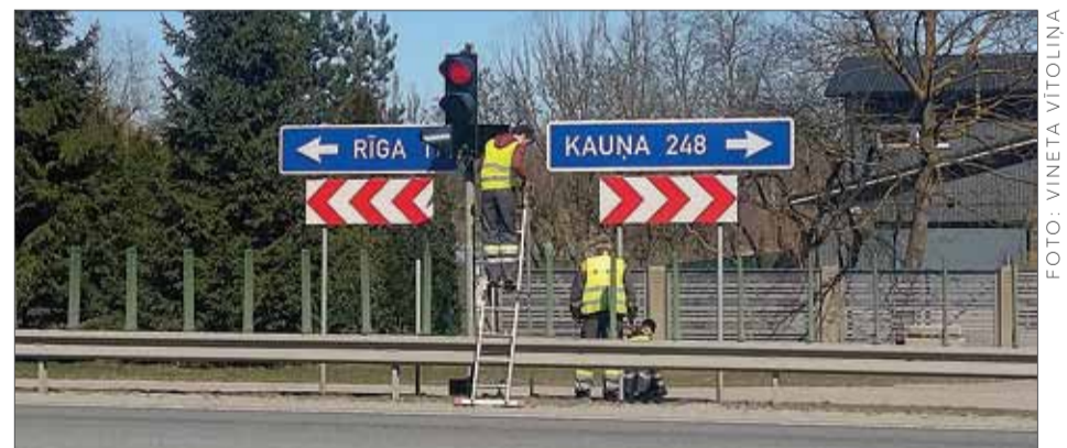
Tiek uzstādīta papildsekcija luksoforam Gaismas ielas un A7 krustojumā.

Atsaucoties iedzīvotāju ierosinājumam, šobrīd Ķekavā izbraukšana pa labi no Gaismas ielas uz autoceļu A7 kļuvusi ērtāka, jo krustojumā luksoforam ir uzstādīta papildsekcija. Līdz ar to ir uzlabota satiksmes organizācija šajā krustojumā un būtiski mazināsies auto sastrēgumi uz Gaismas ielas.