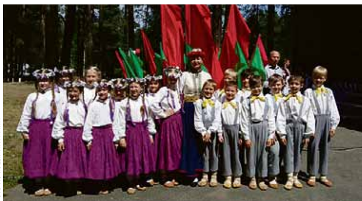
Kolektīvs „Daina” starptautiskajos tradicionālās kultūras svētkos Braslavā.

Festivāla atklāšanas dienā pilsetas laukumā notika ansambļu konkurss ar teatraliem priekšnesumiem un svētku uguņošanu. Savukārt noslēguma koncertā brīvdabas estrādē sagatavotos priekšnesumus demonstrēja starptautiskie kolektīvi. Latviju šajos svētkos pārstāvēja Viļņu