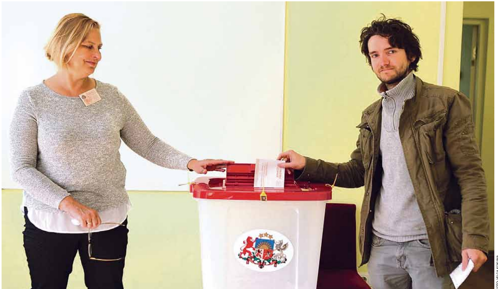
Vēlēšanu iecirkni bērnodrāzā „Zvaigznīte” Valdlaučos 3. jūnijā.

Lai gan pašvaldību vēlēšanas jau tika aizvadītas jūnija pirmajā sestdienā, daļai Ķekavas vēlētajū būs jādodas balsot atkārtoti. Centrālā vēlēšanu komisija (CVK) izsludinājusi atkārtotu balsošanu vēlēšanu iecirknī Nr. 785, kas atrodas Ķekavas kultūras nama 2. stāvā. Atkārtota balsošana šajā iecirknī notiks 22. jūlijā. Šā iecirkņa vēletāji pa pastu tuvākajā laikā saņems uzaicinājumu doties uz atkārtotu balsošanu.