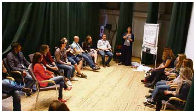
Konferences praktiskajā daļā notika dažādas diskusijas un radošās darbnīcas.

Vieslektori stāstīja par identitātes meklējumiem no žurnālista skatupunkta, Eiropas un latviskās identitātes meklējumiem un veidošanas eksperimentālajā kino, sporta kustību „Ghetto Games” un identitātes veidošanās procesu jauniešu vidū, mūzikas un dziesmu vārdu ietek-