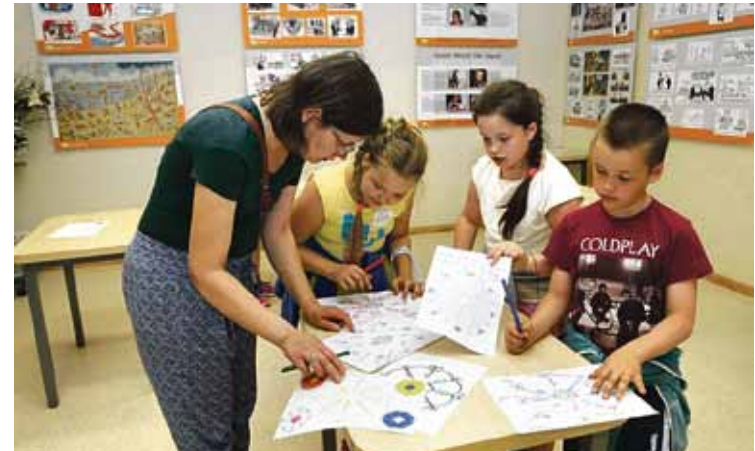
Veidojot savu gadskārtu kalendāru.

Liels paldies Rīgas 6. vidusskolas pūtēju orķestrim „Auseklītis”, kas veselu stundu iepriecināja klausītājus ar skaistām un brašām