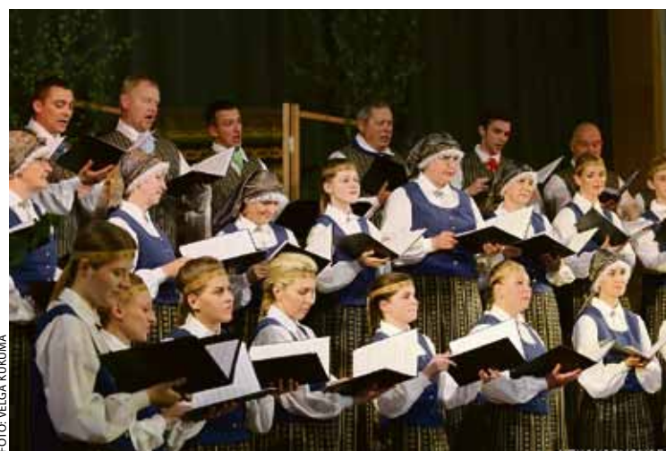
Kora „Mozaika” dalībnieki jaunajos Ķekavas novada tautastērpos, koncertējot Ķekavas kultūras namā.