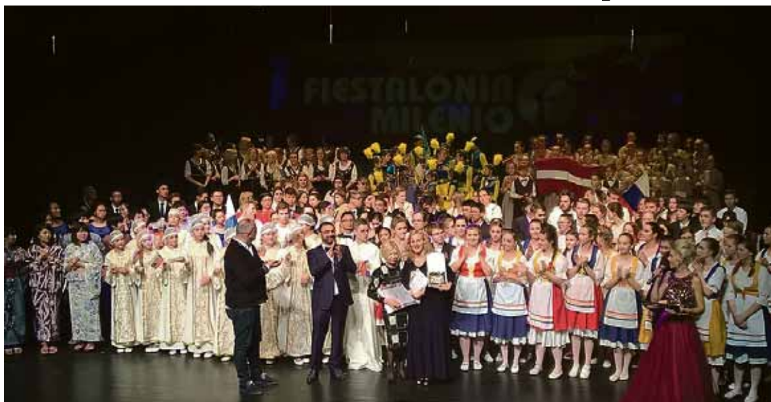
Ķekavas Mūzikas skolas koris festivālā Spānijā.