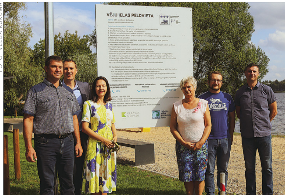
Svinīgi tiek atklāta Vēju ielas atpūtas vieta Ziedonī.

Jūlijā svinīgi tika atklāta labiekārtotā Vēju ielas atpūtas vieta Ziedonī, bet jau pirms tam vasaras tveicīgās dienas iedzīvotāji aktīvi pavadīja šajā vietā, to atzinīgi novērtējot.