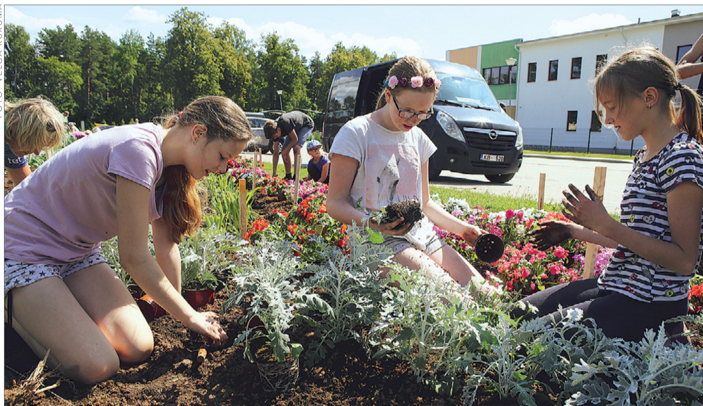
Daugmalē puķu dobes izveidē piedalījās arī vietējie iedzīvotāji un mazpulcēni.