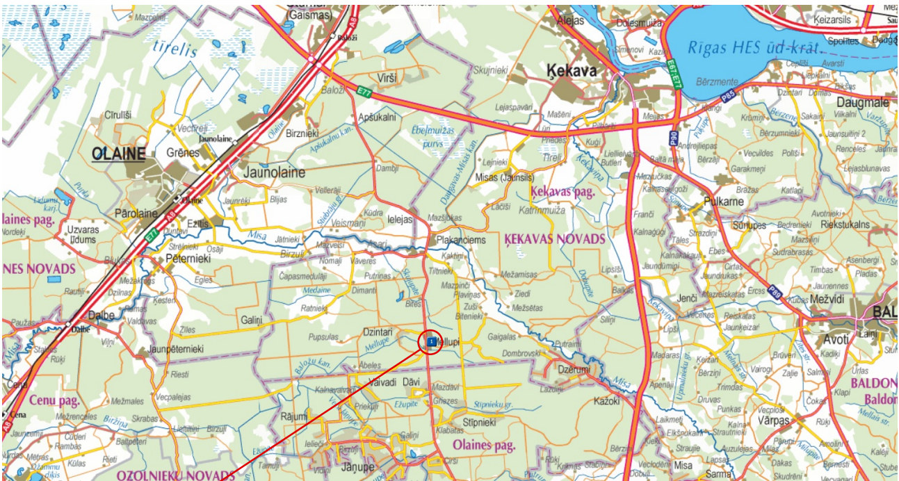
MEŽNIECĪBAS KANTORA ĒKAS REKONSTRUKCIJAS PROJEKTS PAR DAŽĀDU SOCIĀLO GRUPU KOPDZĪVOJAMO MĀJU, "MISAS KANTORA ĒKA", MELLUPI, ĶEKAVAS PAG., ĶEKAVAS NOV.