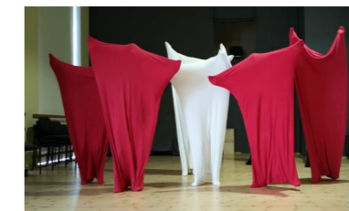
Foto no ģenerālmēģinājuma

Sodien gribam pateikties Jums vecāki par gādību un rūpēm, ko devāt mums skolas gaitās. Arī turpmāk gaidīsim vēl vairāk spēka un izturības. Paldies!