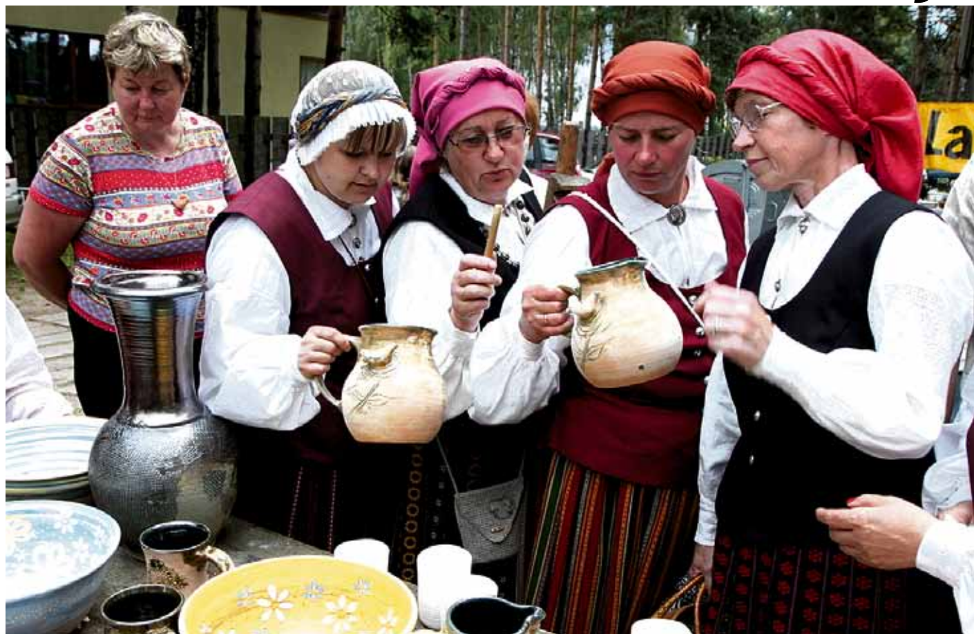
Aplūkojot podnieku meistardarbus

Ķekavas novadā, Katlakalna Zvanītājos, četras dienas dzīvoja, darbojās, virpoja, ķipināja, veidoja, mācījās un citus mācīja podnieki no dažādiem Latvijas novadiem un Lietuvas.