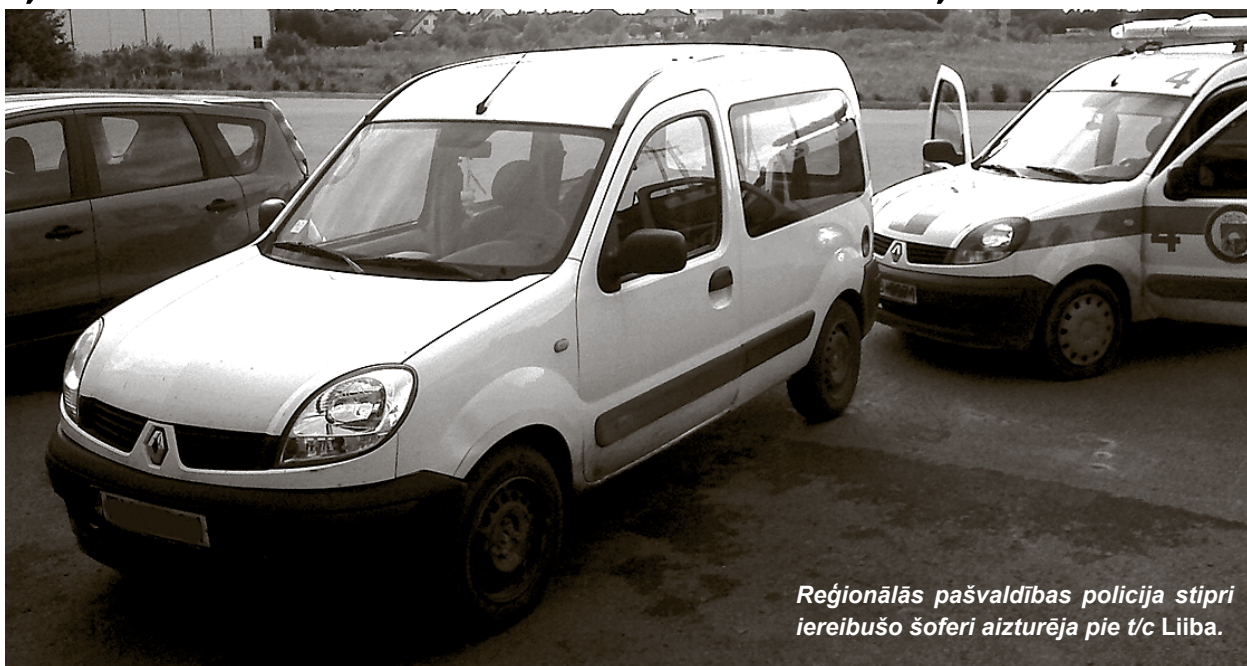
Reģionālās pašvaldības policija stipri iereibušo šoferi aizturēja pie t/c Liiba.

Reģionālā pašvaldības policija Ķekavā aizturējusi autovadītāju, kas sēdies pie spēkrata stūres spēcīgā alkohola reibumā. Alkohola pārbaudē vīrietim konstatētas 3,8 promiles.