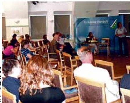
Ķekavas novada sporta konference

Savukārt Izglītības un zinātnes ministrijas Sporta un jaunatnes departamenta vecākais eksperts Edgars Severs izklāstīja valsts redzējumu par sadarbību ar pašvaldībām sporta attīstībā, sporta politikas mērķus, valsts un pašvaldību kompetences sadalījumu sportā (no 2009. gada 1. jūlija sporta veicināšana ir pašvaldību autonomā funkcija), sporta nozares tiesiskā regulējuma pilnveidošanu. Pēc viņa