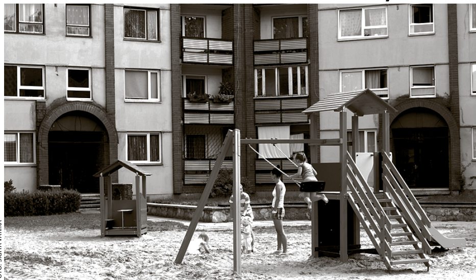
Jaunie rotaļlaukuma elementi Baložu pilsētā

Turpinot pilnveidot atpūtas vietas ģimenēm ar maziem bērniem, Ķekavas novada