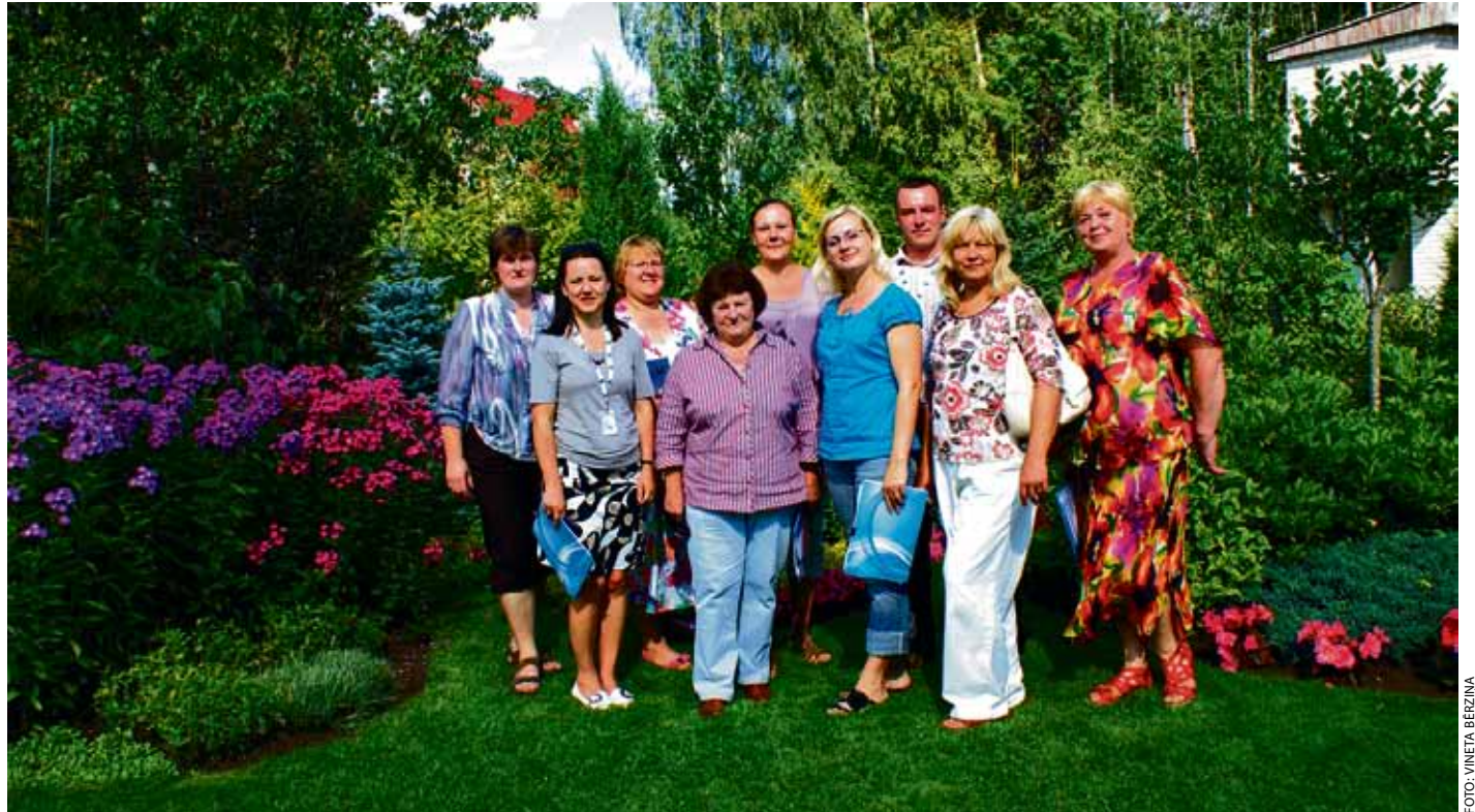
Sakoptākās sētas 2012 vērtēšanas komisija, ciemojoties pie viena no konkursa dalībnieka Dzērumos

Atjaunotā konkursa Ķekavas novada sakoptākā sēta 2012 vērtēšanas komisijai augusta pirmā nedēļa aizritēja ar brīnišķīgiem iespaidiem par novadnieku uzņēmību un radošām idejām, veidojot savu dzīvesvietu vienlaikus gan acij pievilcīgu, gan praktisku.