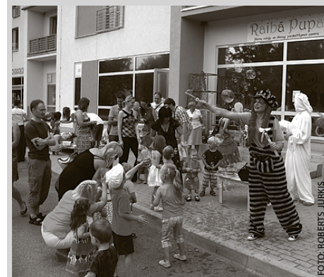
Raibās pupas dzimšanas diena