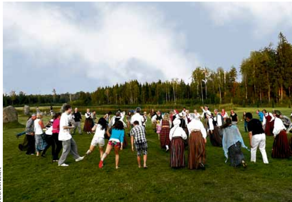
Iepazīstot latviešu tautas daiļradi

Starptautisko sporta spēļu VIA Ķekava 26. jūlija vakarā zemnieku saimniecībā Valmoniras , Plakanciēmā, uz latviešu kultūras vakaru pulcējās sporta spēļu ārvalstu delegāciju oficiālie pārstāvji un sportisti.