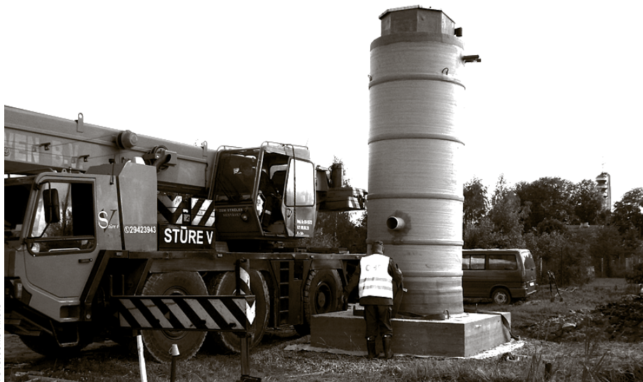
Jaunās sūkņu stacijas korpusa ierīkošana Katlakalnā

jas iespējams saņemt SIA Ķekavas nami birojā Rāmasvas ielā 17, Rāmasvā, vai pa tālruni 29255787 (galvenais inženieris