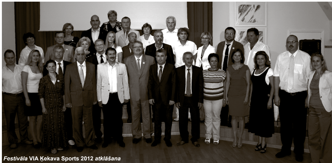
FESTIVĀLA VIA ĶEKAVA SPORTS 2012 ATKLĀŠANA