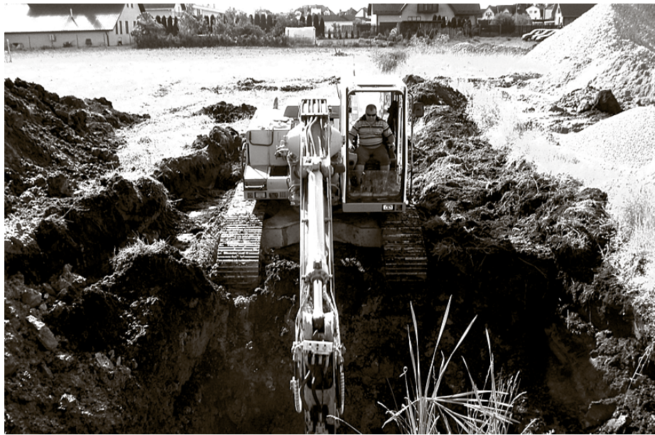
Izbūvējot ūdensvada un kanalizācijas tīklus

Par projekta realizāciju vairāk informāci-