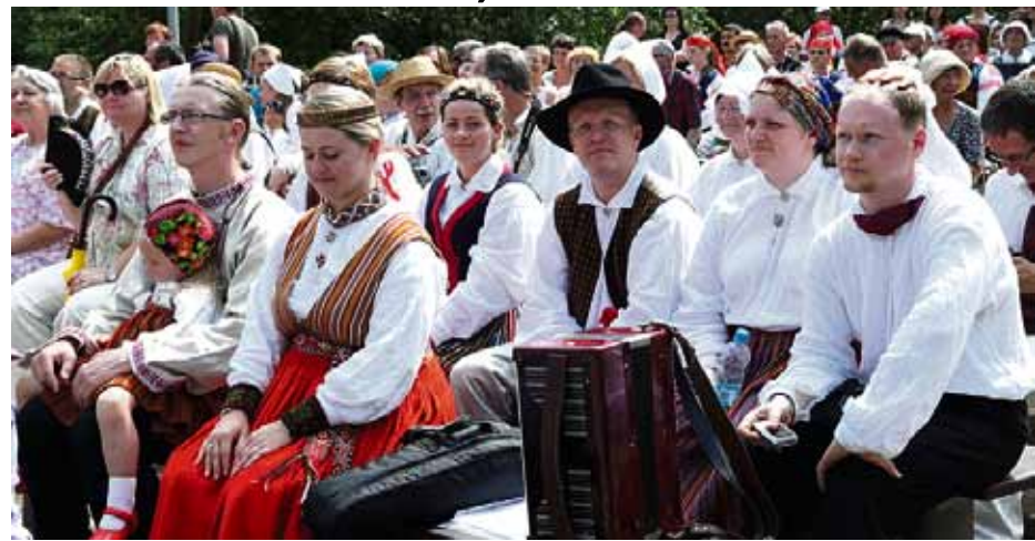
Festivālā pulcējās folkloras kopas no dažādām valstīm.

Mūsu novadā festivāls Baltica notika pirmo reizi ar koncertu Latvieši pasaulē – pasaule latviešos . 8. jūlijs Ķekavā sākās ar skaistu, saulainu vasaras rītu, ar folkloras kopu ierašanos no ASV – Sudrabavots un Teiksma , Luksemburgas – Dzērves , Lielbritānijas – Dūdalnieki , Krievijas – Daina , Igaunijas – Rēvele un mūsu pašu folkloras kopām no Latvijas, ar pulcēšanos ābeļdārzā un savstarpējo iepazīšanos, ar