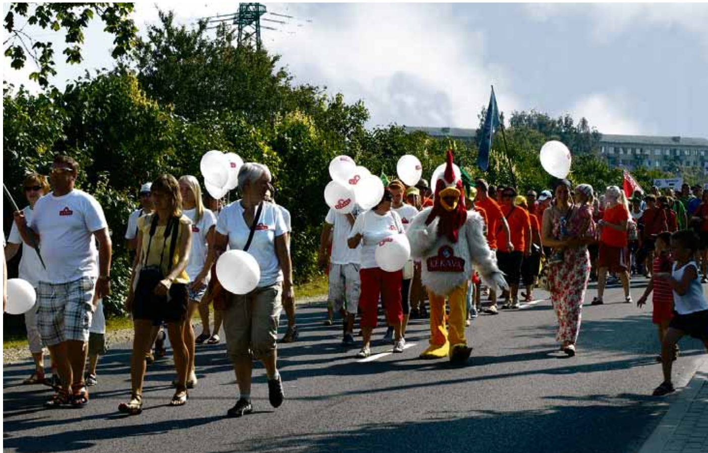
Sporta spēļu dalībnieku svētku gājiens

Svētku gājiens virzījās no tirdzniecības