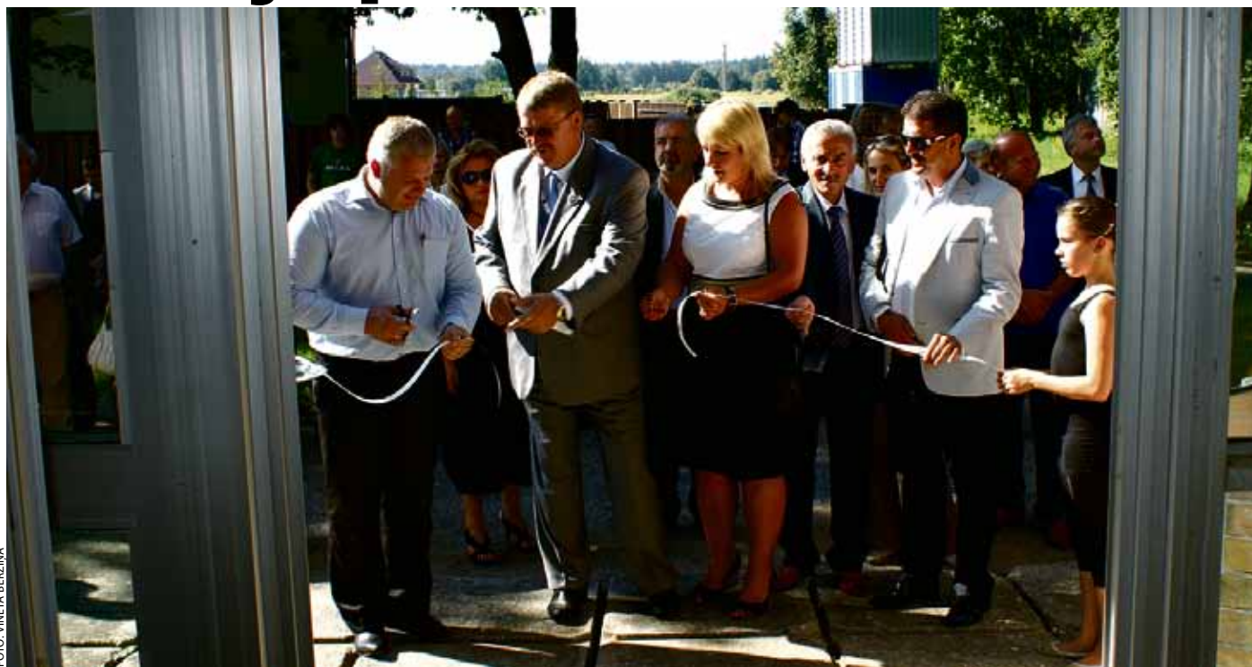
Atklājot saules kolektoru Ķekavas sporta klubam

Starptautisko sporta spēļu VIA Ķekava otrā diena aizsākās ar svinīgo Ķekavas sporta kluba saules kolektora sistēmas atklāšanas ceremoniju.