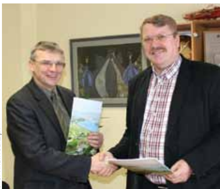
Valdlaučos atklāj aptieku ⇒ 3. lpp.