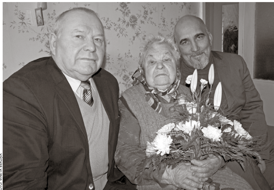
Jubilāre kopā ar Ķekavas novada Domes pārstāvjiem

Vēlam jubilārei veselību, dzīvesprieku un interesi par dzīvi saglabāt arī turpmāk!