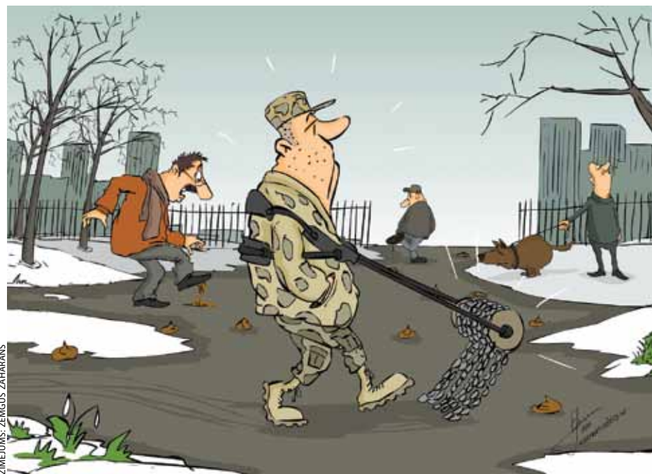
ZĪMĒJUMS: ZEMGUS ZAHARĀNS

Neiedomājos palīdzību šī jautājuma sakārtošanā meklēt Ķekavas Drošības, sabiedriskās kārtības un satiksmes komitejā.