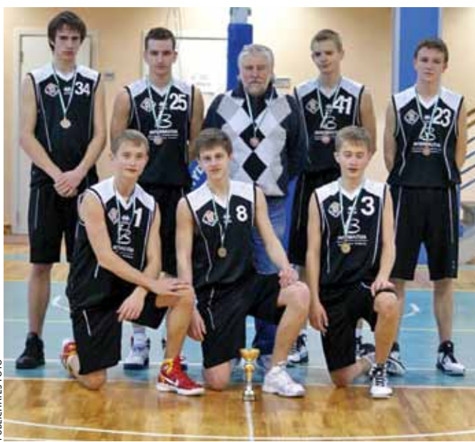
Ķekavas basketbolisti – bronzas medaļas ieguvēji kopā ar savu treneri Cēsīs