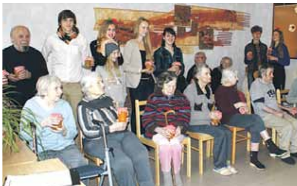
Ciemos pie Ķekavas sociālā aprūpes centra senioriem