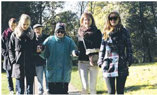
Pastaigā uz Ķekavas parku