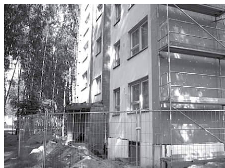
Siltumnoturības uzlabošanas pasākumi Baložos ēkām Rīgas ielā 16 (augšā), 18 un Uzvaras prospektā 4

sistēmās ir gaiss, apkures sistēmu atgaisošana tika veikta operatīvi.