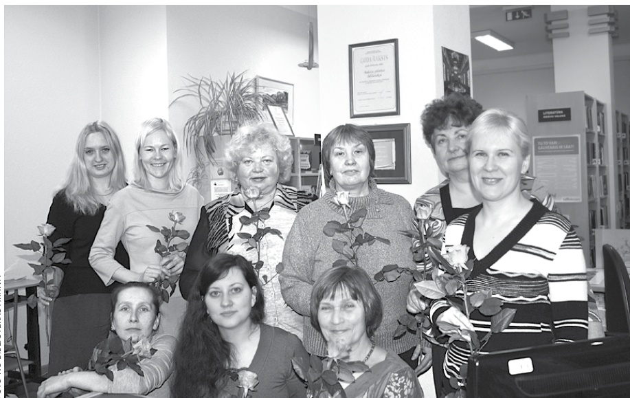
Bibliotēkas darbinieku kolektīvs 2013. gadā

2000. gados bibliotēkai sākās uzplaukuma laiks kā materiālajā, tā arī sabiedriski aktīvajā ziņā. Baložu pilsētas dome atbalstīja bibliotēkas attīstību, izprotot tās nozīmību un vajadzības. Bibliotēkārās sistēmas ALISE iegāde būtiski mainīja bibliotēkas darbu un kļuva par galveno nosacījumu, lai 2009. gadā, Baložu pilsētai iekļaujoties Ķekavas novadā, Baložu bib-