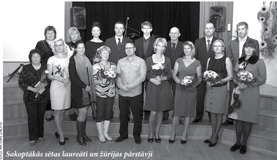
Sakoptākās sētas laureāti un žūrijas pārstāvji

lauku sētu Kalēji Daugmales pagastā. Vasaras pilnbriedā šeit vilina saldu ogu pilns vīnogulājs, kas dienvienu saulītē apvijies pergolas koka karkasam. Šis zaļojošais īpašums, kur saimnieko aktīvi vietējie uzņēmēji, ieguva 3. vietu pēc iegūto punktu skaita.