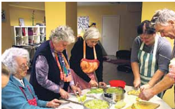
Ķirbju ievārijuma vārīšana