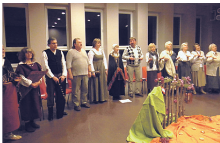
Ķekavas kultūras namā izskanēja koncerts Šķērsu dienu saule tek .