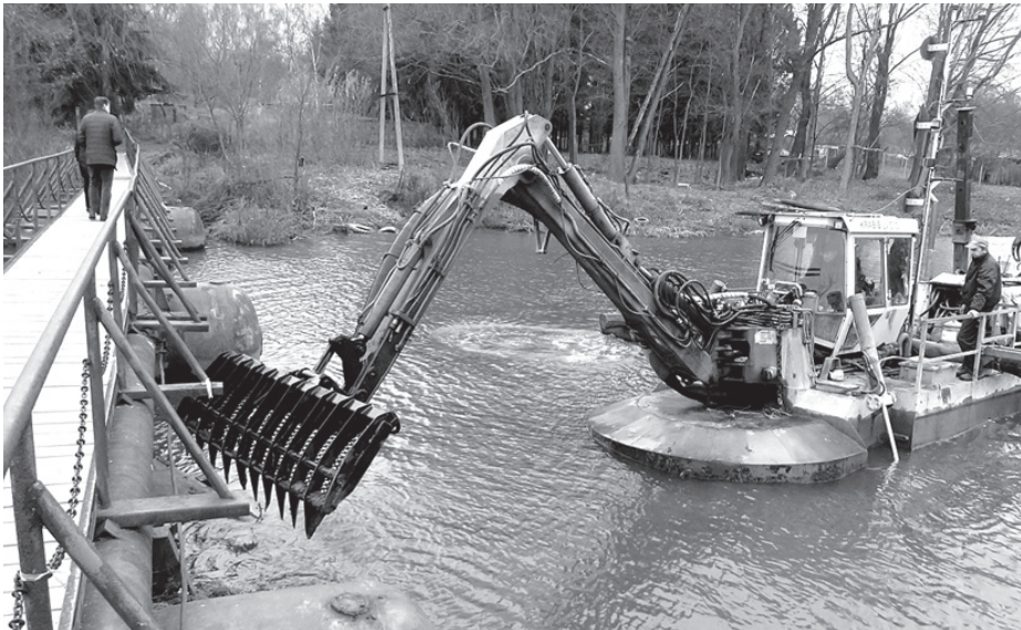
Olektes upes gultnes tīrīšanas 1. kārtā

Papildus upes šķērsotāju drošībai ir veikts tilta pontonu novērtējums, klāja nomaiņa un profilaktiskie pasākumi tilta peldspējas saglabāšanai.