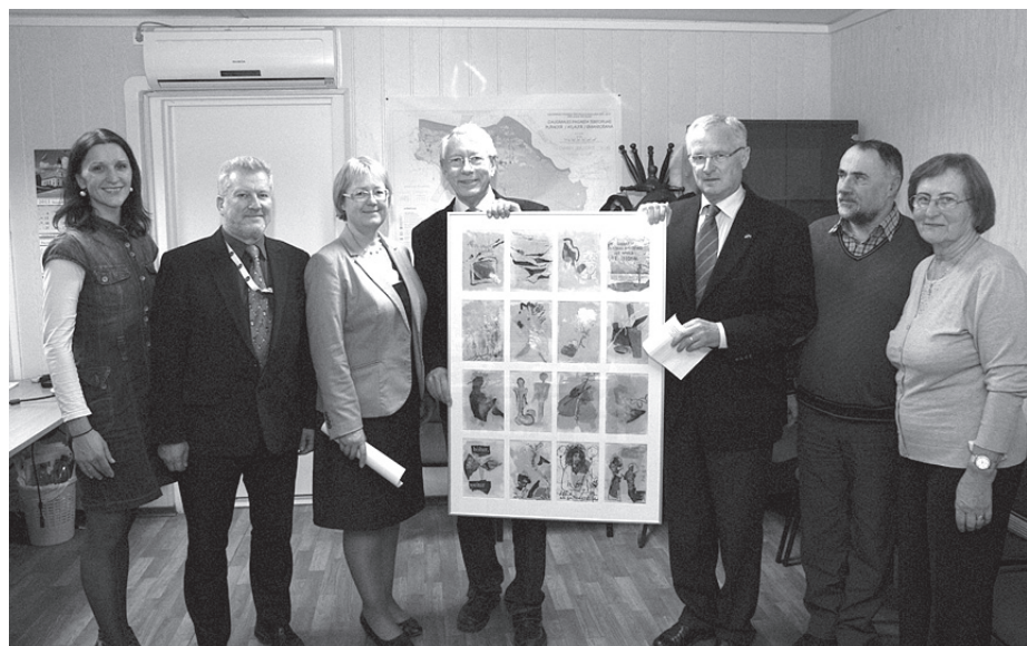
Bordesholmas pārstāvji Ķekavas novada pašvaldībā tikās ar jomu speciālistiem.