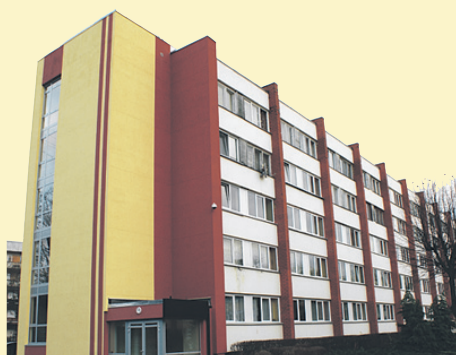
Jaunais Ķekavas sociālās aprūpes centra lifts