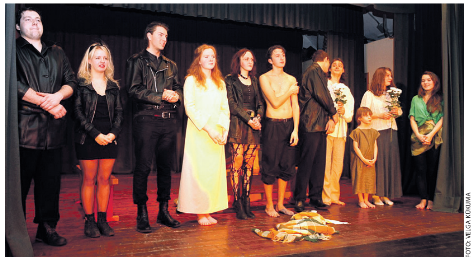
Jauniešu teātra studija iestudēja Henrika Ibsena izrādi Pērs Gints