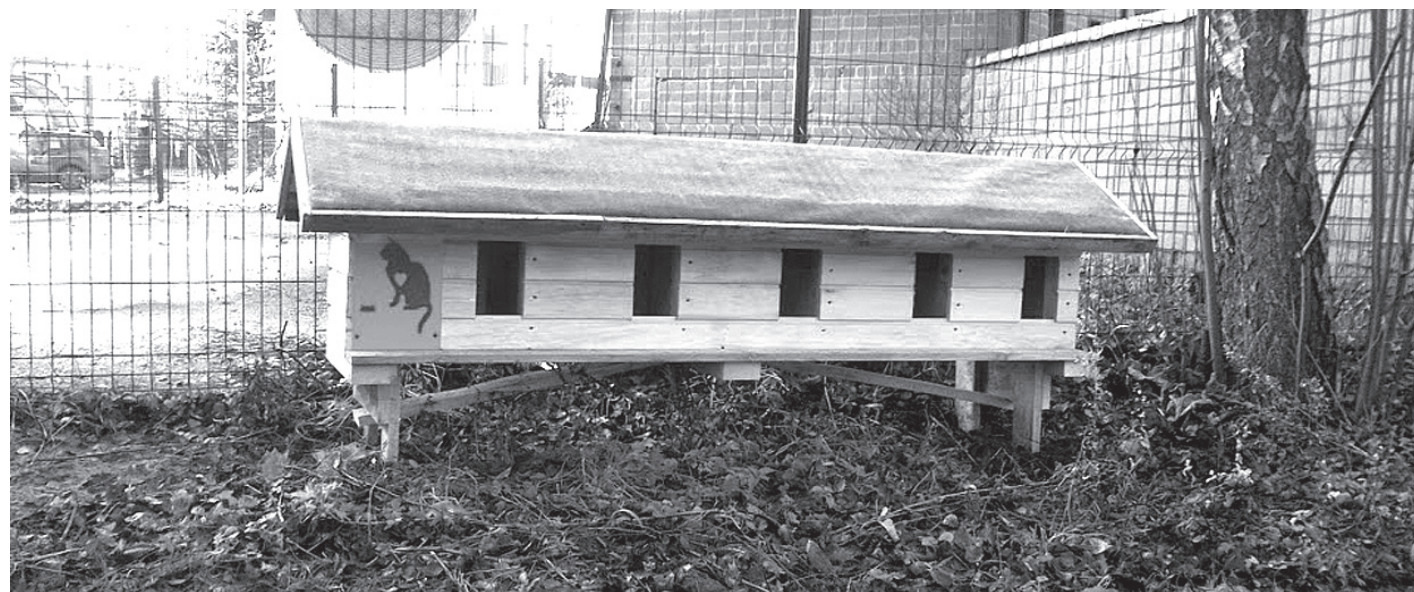
Pirmās kaķu mājas Ķekavas novadā

Ķekavas novads ir pirmais Latvijā, kurā tiek kompleksi risināti bezsaimnieku kaķu aprūpes jautājumi – sakārtota likumdošana, radīta dzīvnieku aprūpei piemērota vide, kā arī tiek izglītoti novada iedzīvotāji.