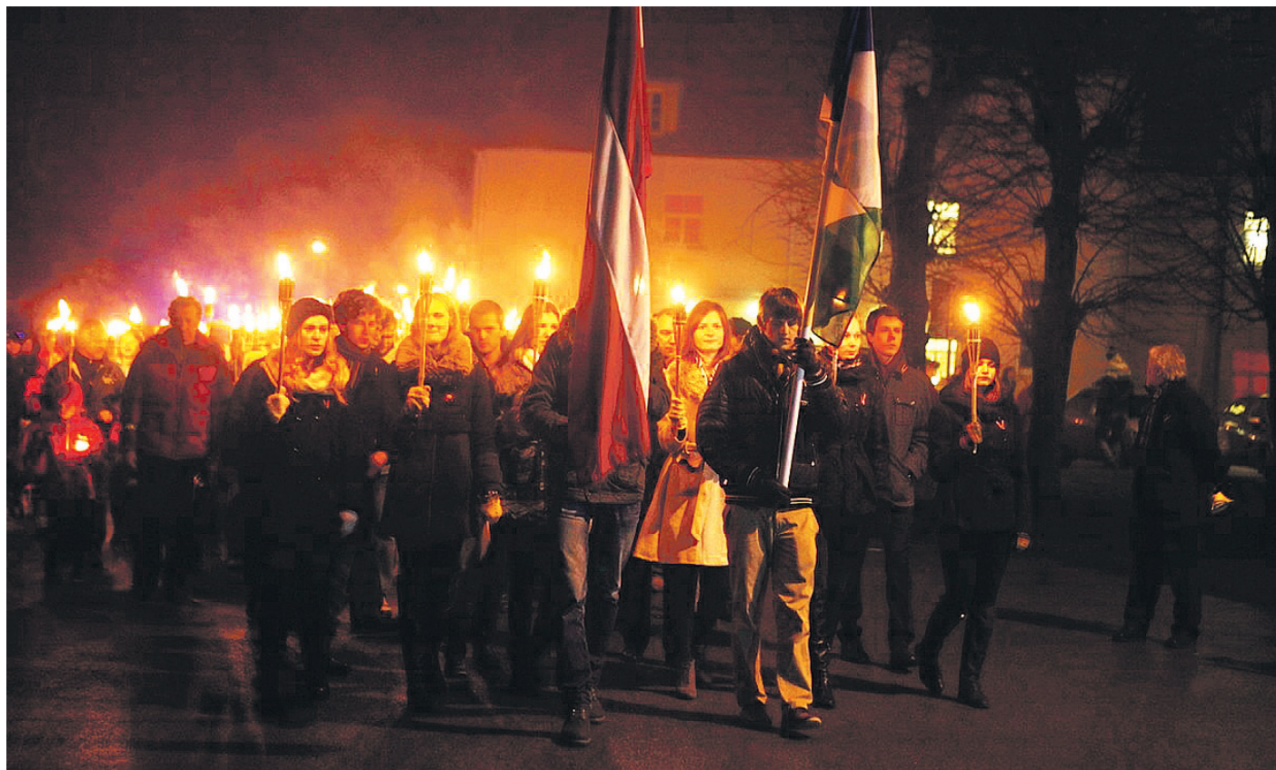
Lāpu gājiena Ķekavā galamērķis – rokkoncerts kultūras namā