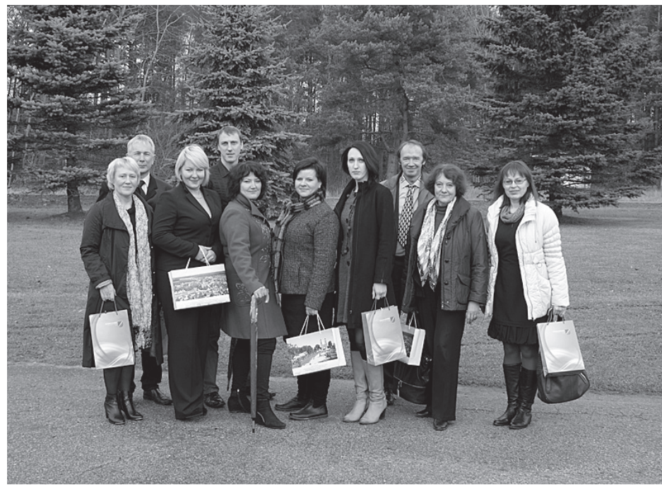
sākumskola, ar kuras apskati noslēdzās lietuviešu vizīte Ķekavā.

Lietuvas delegācija apmeklēja pašvaldības ēku un kultūras iestādes, lai izvērtētu iespējas rīkot kopīgus Lietuvas un Latvijas kultūras pasākumus Ķekavas novadā. Atzinīgi tika novērtēta arī Ķekavas jaunā