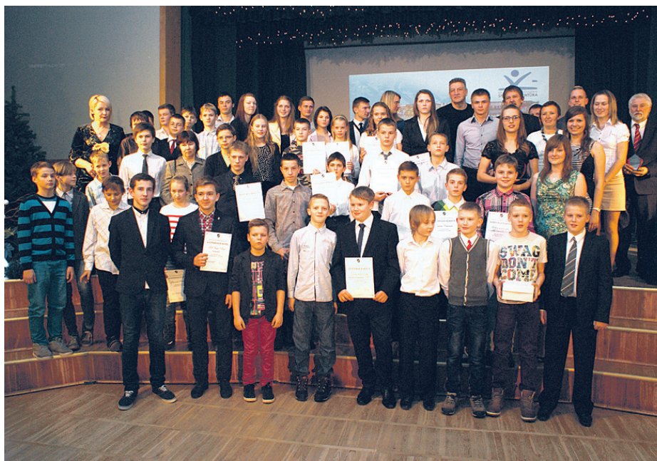
Ķekavas kultūras namā tika apbalvoti Ķekavas novada labākie sportisti, treneri, komandas, atbalstītāji.