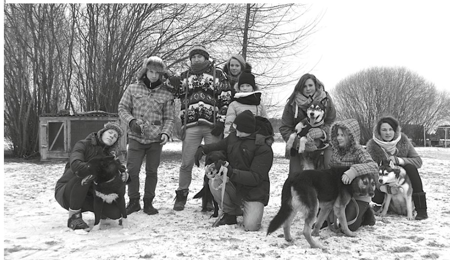
Jaunieši dzīvnieku patversmē Mežavairogi

Biedrība Dzīvnieku patversme Mežavairogi turpina īstenot pērn uzsāktu projektu Kvalitatīvas dzīves vides nodrošināšana Ķekavas novadā. Šī projekta ietvaros Mežavairogi sadarbojas ar vēl divām nevalstiskajām organizācijām (NVO) – biedrībām Astes gredzenā un VeteDeve, kā arī ar Ķekavas novada pašvaldību, apvienojot spēkus kopīga mērķa sasniegšanai.