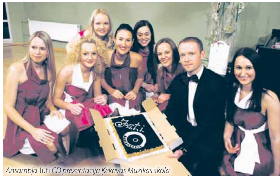
Ansambļa Jūti CD prezentācijā Ķekavas Mūzikas skolā