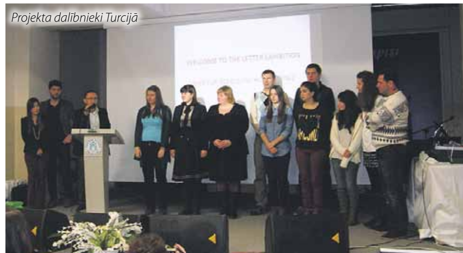
Projekta dalībnieki Turcijā

Jāpiesakās rakstot uz solis.tuvak@inbox.lv , norādot savu motivāciju dalībai projektā.