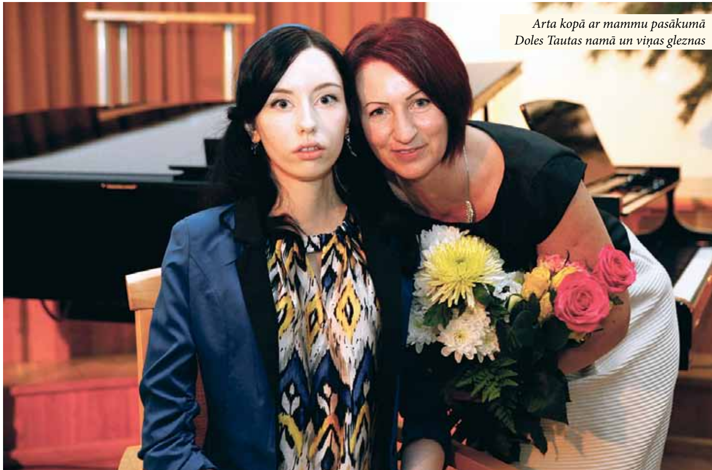
Arta kopā ar mammu pasākumā Doles Tautas namā un viņas gleznas

Mīļie, atsaucīgie, tik ļoti savējie, novada ļaudis, mēs no visas sirds vērsamies pie jums, varbūt jūs Ziemassvētku steigā un tik saspringtajā gada nogalē, kad daudzus nomāca naudas maiņas jautājums un dažādas sadzīviskas problēmas, vienkārši nemanot esat pagājuši garām ziedojumu kastītēm, kas atrodas Ķekavas kultūras namā, Doles Tautas namā – bibliotēkā un Tūrisma koordinācijas centrā, Baložu