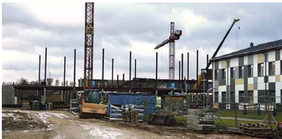
Ķekavas sākumskolas II kārtā

Sagaidot jauno gadu, Ķekavas novada pašvaldībā tiek ieskicēti svarīgākie darbi nākamajam darba cēlienam. Arī lielākie būvniecības plāni jau ir skaidri.