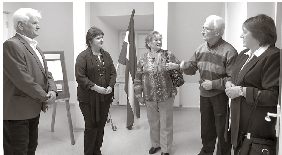
Muzejā tiekas vēsturisko materiālu dāvinātāji

Pie tējas tases risinājās atmiņas par PMK laiku, par putnu fabrikas celtniecību, kolhozu laikiem. Sanākušie atzina, ka pašiem bijis aizraujoši dalīties ar pieredzēto, jo, pasakot vienu teikumu, tas