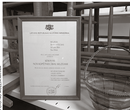
Apliecība demonstrē muzeja atbilstību valstī pieņemtajiem kritērijiem

Lai muzeju varētu akreditēt, Ķekavas muzeja darbinieki ieguldījuši daudz darba, pārbaudot un sistematizējot visu dokumentāciju, veicot muzeja krājuma uzskaiti,