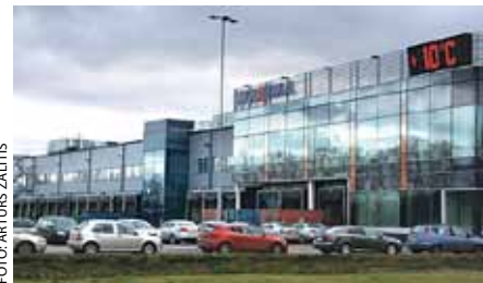
SIA Maxima Latvija noliktava

Ķekavas novada būvvaldes būvinspektori šobrīd jau ir pārbaudījuši gandrīz visas apzinātās būves, tajā skaitā Pļavniekkalna sākumskolu, Ķekavas sākumskolas jaunbūvi, Ķekavas sociālās aprūpes centra vajadzī-