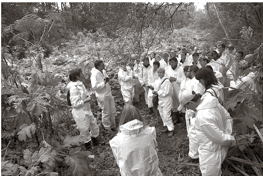
Praktiskajā nodarbībā Ķekavā

23. jūlijā Vides un labiekārtošanas daļas darbinieki piedalījās AS Latvijas valsts meži un Integrētās audzēšanas skolas rīkotajā seminārā, lai iegūtu jaunu informāciju par sasniegto izpētes projektā Latvāņa ierobežošanas metožu efektivitātes salīdzināšana, rekomendāciju sagatavošana.