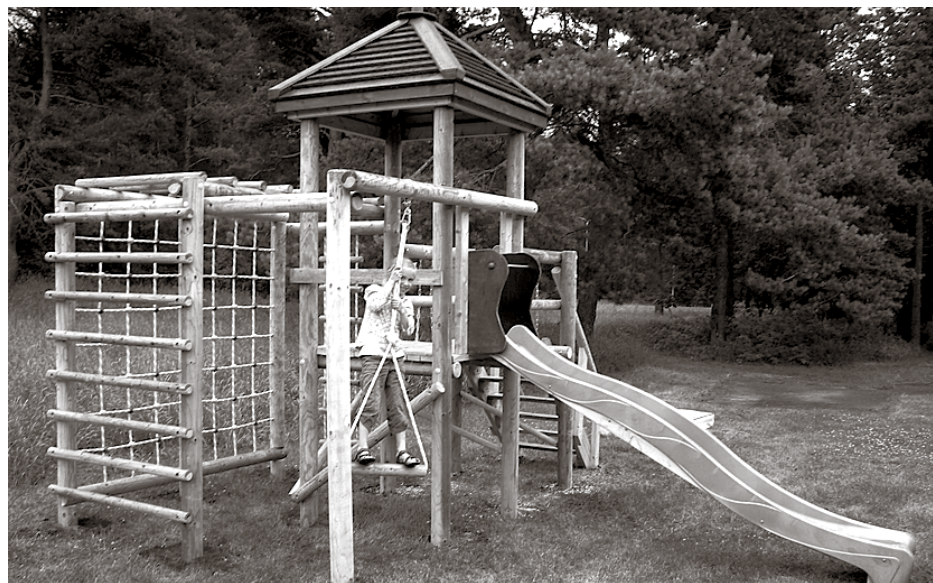
Jaunais rotaļu laukuma elements pie dzīvojamās mājas Baložos, Smilšu ielā 2

Startējot Ķekavas novada projektu līdzfinansēšanas konkursā un saņemot finansiālu atbalstu 1425 latu apmērā no Ķekavas novada pašvaldības, biedrība Labie nodomi projektā Bērnu rotaļu laukuma izveide Baložu pilsētā uzstādīja rotaļu laukuma elementu Baložu pilsētā.