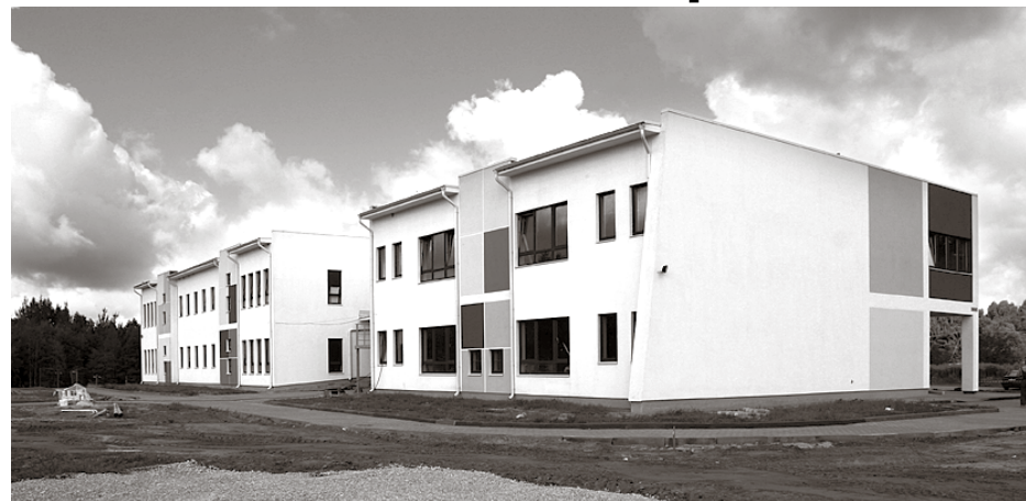
Jaunais Daugmales bērnodārzs