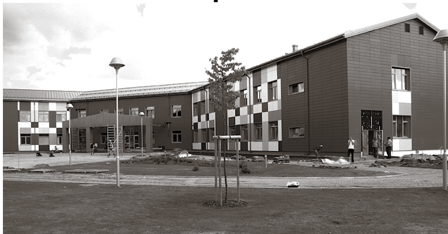
Jaunā Ķekavas sākumskola dažas nedēļas pirms atklāšanas

Ķekavas ainavā pamazām dabiski iekļāvusies jaunā sākumskolas ēka, celtniecības darbi tuvojas noslēgumam, patīkamā satraukumā ir pirmo klašu audzēkņu sirsniņas, uzlūkojot nākamo mācību iestādi. Tuvojas brīdis, kad ēku piepildīs bērnu čalas un smieklis.