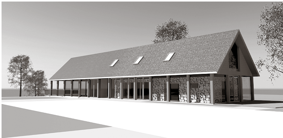
Ķekavas novada jaunatnes iniciatīvu centra jaunās ēkas idejiskais skiču projekts

25. jūlijā Ķekavas novada domes sēdē deputāti tika iepazīstināti ar Ķekavas novada jaunatnes iniciatīvu centra jaunās ēkas idejisko skiču projektu (metu).