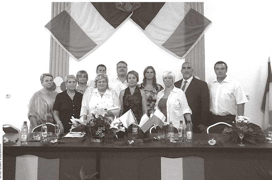
Projekta laikā Rumānijā

Pēc konferences apmeklējām Bistricas pilsētas veco ļaužu aprūpes iestādi, kas paredzēts 40 personām. Šobrīd 63 seniori gaida rindu iespējai dzīvot aprūpes centrā. Pansionāts vienai personai izmaksā 150 eiro mēnesī. No klienta pensijas finansēšanai tiek izmantoti 60 %, bet 40 % tiek atstāti klientam patēriņa vajadzībām, pā-