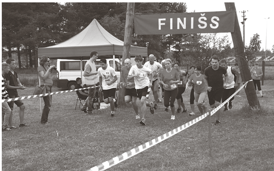
Gandrīz ideālais skrējienis

Spraigas ciņas starp komandām izvērtās strītbolā, futbolā, pludmales volejbolā un florbolā, bet savu precizitāti ikviens varēja pārbaudīt šautriņu mešanā, futbola sitienos, basketbola soda metienos un novusā. Spēku parādīt bija iespējams lodes grūšanā, virves vilkšanā un svaru bumbu