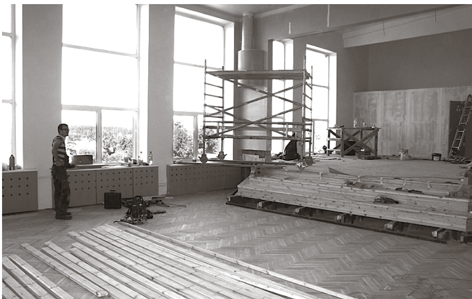
Remontdarbi Ķekavas vidusskolas aktu zālē

Arī vairākās pirmsskolas izglītības iestādēs noris darbi – bērnudārzā Ieviņa ir pabeigts psihologa un mūzikas kabineta remonts, bet darbi vēl turpinās kāpņu telpā. Bērnudārzā Zvaigznīte papildus jau paveiktajam darbam, kura ietvaros remontēti gaiteni, kāpnes un veikta linoleja nomaiņa, ar jauniem elementiem papild-