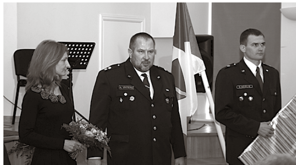
Laba vēlējumus teic Valsts policijas Rīgas reģiona pārvaldes pārstāvji.

Savukārt septiņi RPP jaunie darbinieki ar zvērestu apliecināja savu izvēli strādāt savas valsts, novada un sabiedrības labā. Daudz labu vārdu un pateicību Reģionālās pašvaldības policijas darbiniekiem un tās vadībai izteica