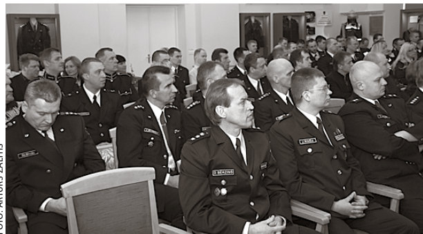
Jubilejā bijuša pulcējušies RPP darbinieki, kolēģi no Valsts policijas, pašvaldību pārstāvji un sadarbības partneri.