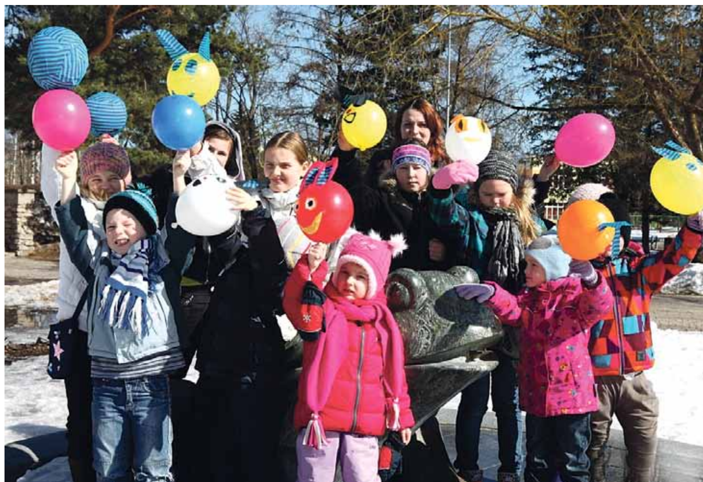
Lieldienu radošās darbnīcas Baložu pilsētā

Lai nu kā, bet Lieldienas bija jūtamas visā Ķekavas novadā! Tām gatavojās kā lieli, tā mazi.