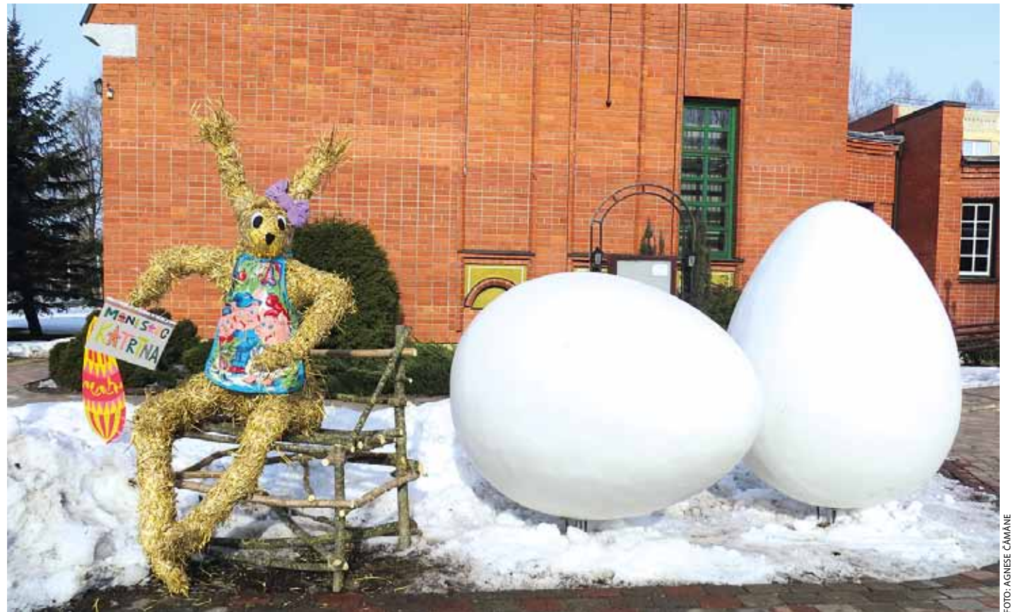
Lieldienu dekorācijas pie Baložu pilsētas pārvaldes