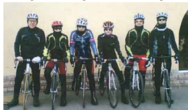
No nometnes vietas Slovākijā

Nemot vērā, ka Latvijas ģeogrāfiskais izvietojums ir nelabvēlīgs ritenbraukšanas mācībām un treniņiem, it sevišķi pavasara sagatavošanās periodam, pirms sezonas pirmajiem startiem ir nepieciešama pirmsezonas galvenā sagatavošanās mācību treniņu nometne ārzemēs, kas ir vairāk uz dienvidiem.