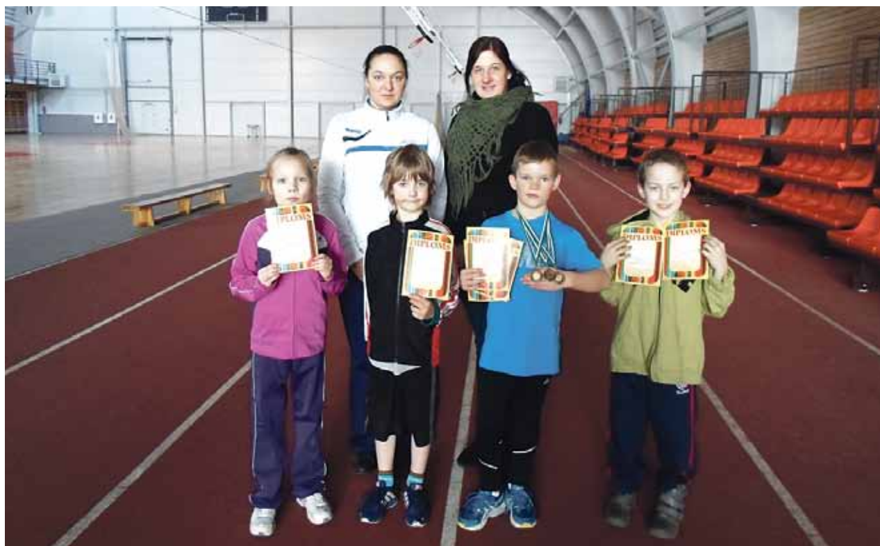
Ķekavas novada sporta skolas jaunākie vieglatlēti kopā ar trenerēm