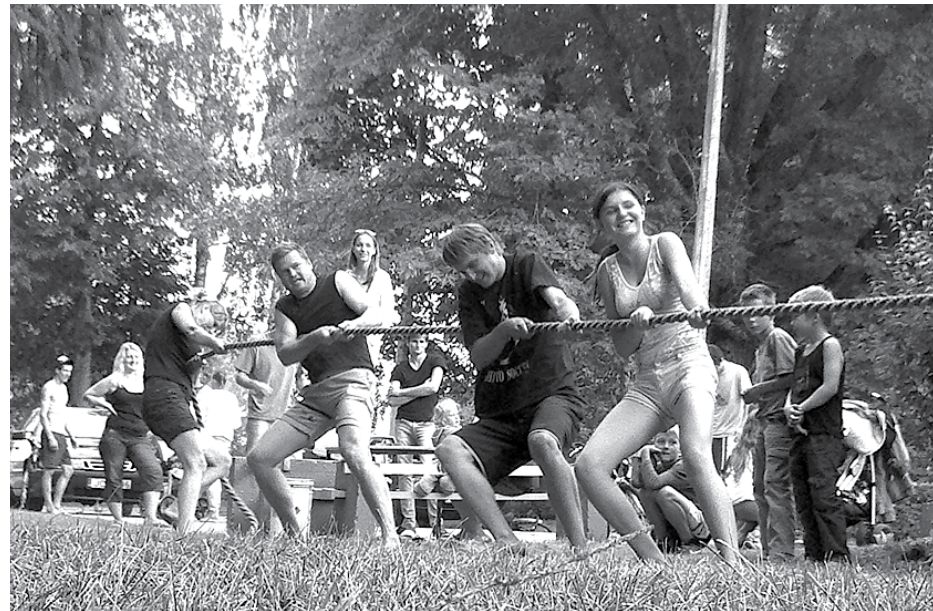
Viena no sporta dienas disciplīnām – virves vilkšana

Pasākuma organizators uzskata, ka pasākums ir izdevies, jo Daugmales pagasta