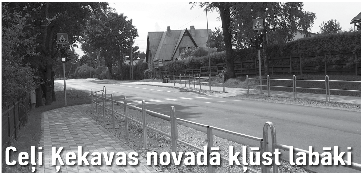
Ļavniekkalna ielas ietve un jaunais luksofors pie Ļavniekkalna sākumskolas

Piesaistot gan Eiropas Savienības finansējumu, gan atlicinot līdzekļus pašvaldības budžetā, Ķekavas novadā pakāpeniski tiek uzlabots pašvaldības piederošu ceļu un ielu stāvoklis.