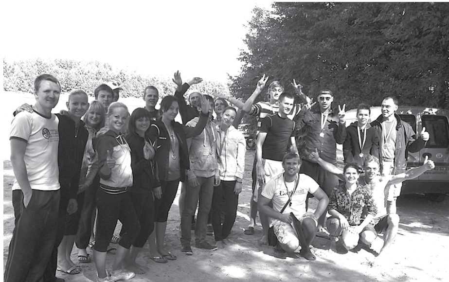
Laivu brauciena dalībnieki

24. augustā Ķekavas novadā norisinājās laivu brauciens apkārt I pasaules kara kaujas vietai – Nāves salai.