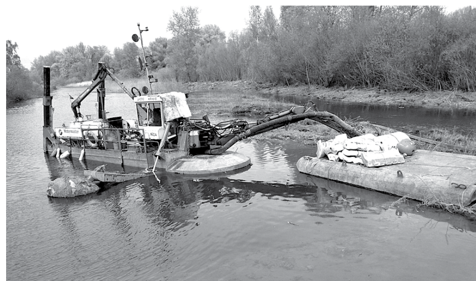
Ar īpašu tehniku tiek attīrīta Olektes upes gultne