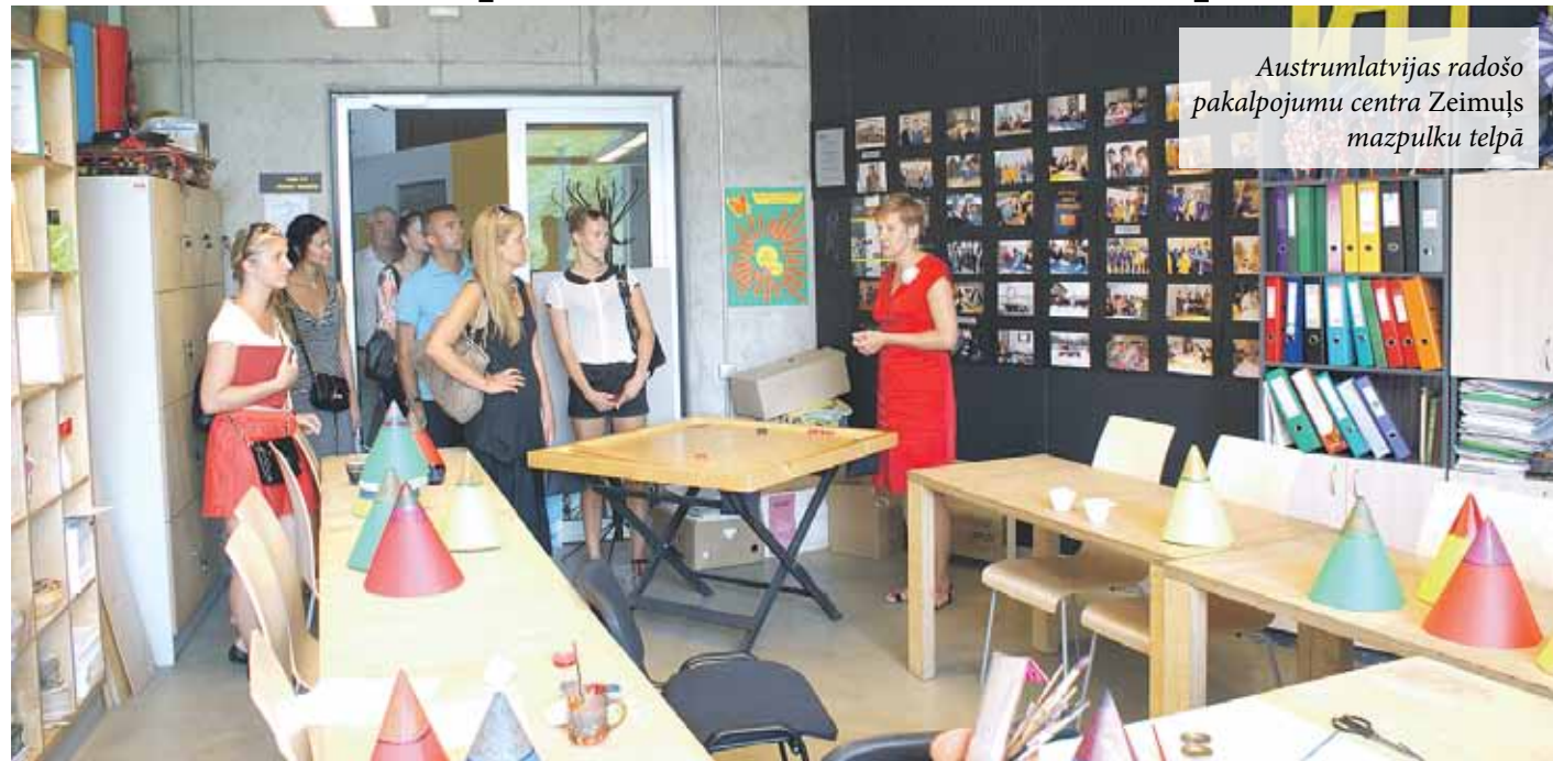
Austrumlatvijas radošo pakalpojumu centra Zeimuļš mazpulku telpā