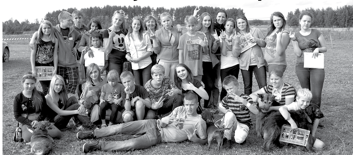
Projekta dalībnieki dzīvnieku patversmē Mežavairogi

Draudzība, smaids, lidzi jušana, sa- pratne, atbalsts, prieka asaras – tās ir emocijas, kuras 50 Ķekavas novada jaunieši piedzīvoja projekta Tu vari! laikā visas vasaras garumā dzīvnieku patversmē Mežavairogi .