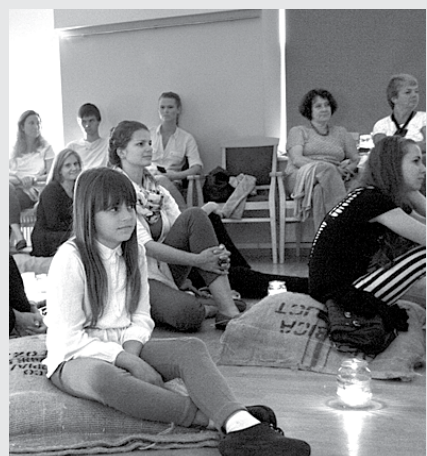
Akcijas noslēgums Doles Tautas namā