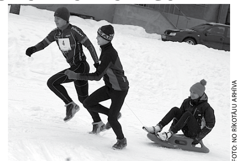
Mirklis no II Ziemas sporta spēlēm

Izvērtīti sacensību rezultāti un foto no