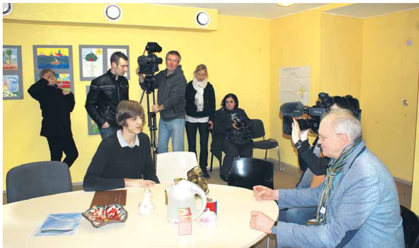
LTV1 seriāla Enģeļu mājas sižeta filmēšana Jaunatnes iniciatīvu centrā

Viss sākās ar telefona zvanu Ķekavas novada pašvaldībai no seriāla Enģeļu māja filmēšanas grupas ar lūgumu sniegt informāciju par sirsniņiem un izpalīdzīgiem cilvēkiem, ar kuriem mūsu novadā lepojas.