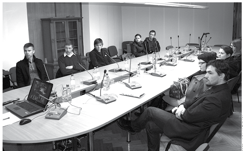
Dibinot Baložu pilsētas jauniešu padomi