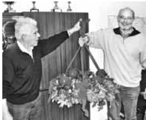
Kā ik gadu, no Bordesholmas atceļojis Adventes vainags, kas visas svētku dienas rotās pagasta padomes ēkas vestibulu.