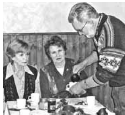
Arī senioriem veltīta pēcpusdienu, kurā galdus klāj un viesus cienā Bordesholmas kungi, pieder pie tradīciju klāsta.