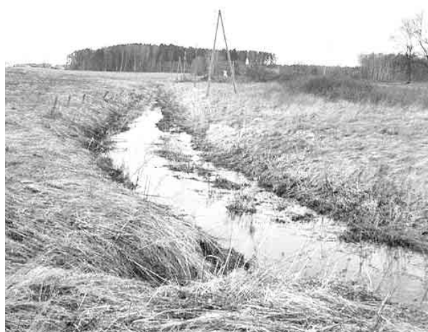
Bez saimnieka rokas....