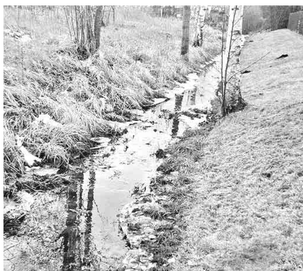
Var redzēt: katram krastam savs īpašnieks.