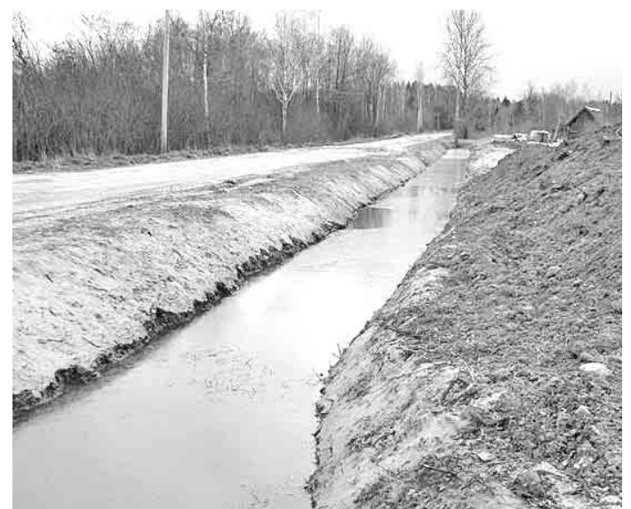
Tāds izskatās sakopts grāvis!

Gruntsūdeņu līmeņa celšanās, kā arī lietus un sniega kušanas ūdeņu novadīšana ir kļuvusi ļoti aktuāla vispārīgo klimata pārmaiņu ietekmes rezultātā un sagādā nopietnas problēmas mūsu pagasta apbūvēto teritoriju iedzīvotājiem.