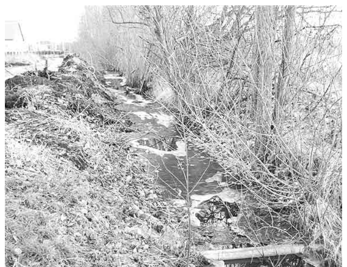
Caur nekoptiem briķšņiem...