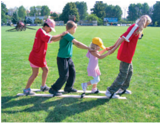
Ja ziemā nav sniega, tad tiekam pie panākumiem vasaras slēpojumā.