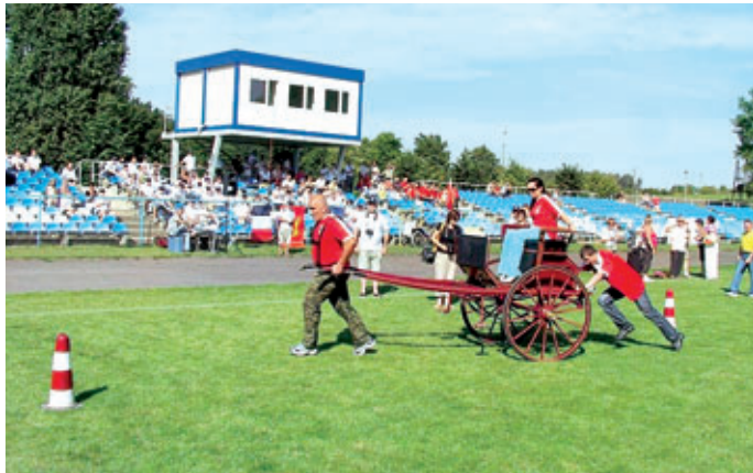
Spēka, veiklības un ātruma sacensību dalībnieki.