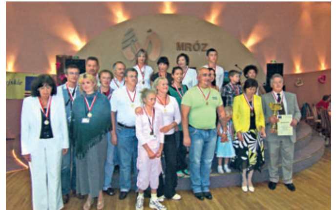
Sacensību kopvērtējumā ieguvām 2.vietu.