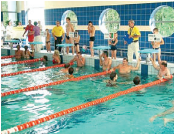
Pirms peldēšanas sacensībām jaunuzceltajā peldbaseinā.