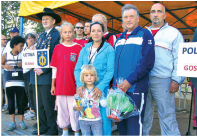
Ķekavas pārstāvji - Komanda.

Māra Ozoliņa fotoreportāža no II Eiropas sporta spēlēm Polijas pilsētā Gostinā. Vairāk lasiet 4.lpp.