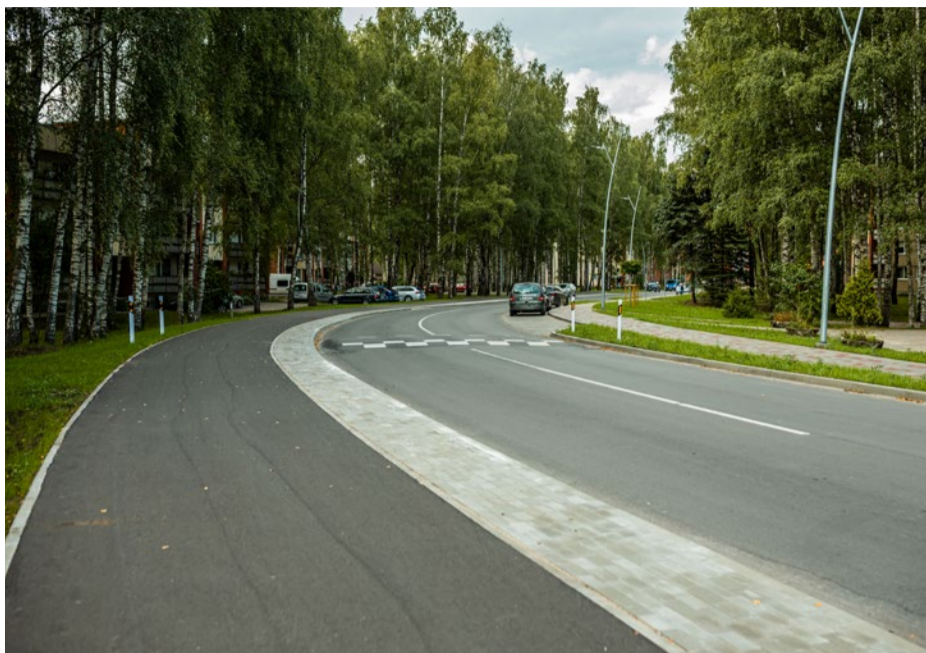
Uzvaras prospekts pēc pārbūves.

turvietās uzstādītas nojumes, deviņi soli, trīs velonovietnes un astoņas jaunas atkritumu urnas. Tāpat izbūvēts jauns apgais-