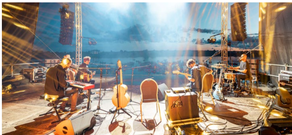
Grupas „The Sound Poets” laivu koncerts uz Daugavas.