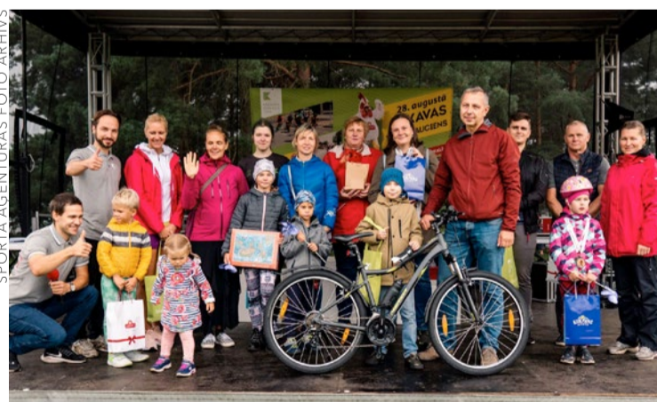
Mirkļis no slēpņu spēles galvenās balvas izlozes.

Šoreiz uzdevums nebija no vieglajiem – daži slēpņi bija paslēpti īpaši rūpīgi, bet tāpēc jau tā ir slēpņu spēle, lai būtu mazliet cītīgāk jāpameklē. No visām iesūtītajām anketām ar pareizajām atbil-