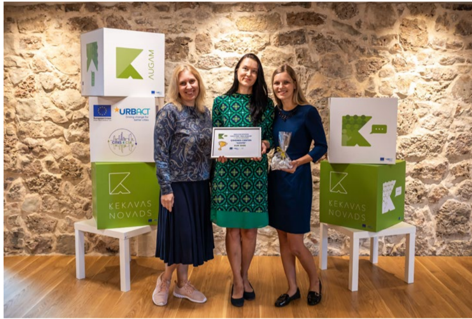
Ideju hakatona 1. vietas ieguvējas.

Apkopojot žūrijas vērtējumu, ņemot vērā problēmsituācijas aktualitāti, idejas dzī-