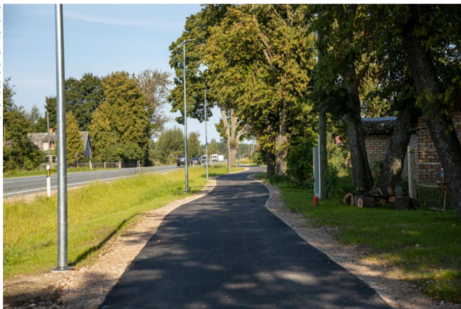
Izbūvētais veloceliņa pirmais posms Ķekavā.