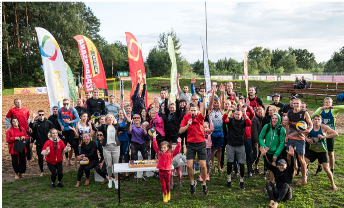
Pludmales volejbola čempionāta dalībnieki.

Ķekavas novada pašvaldības Sporta aģentūra