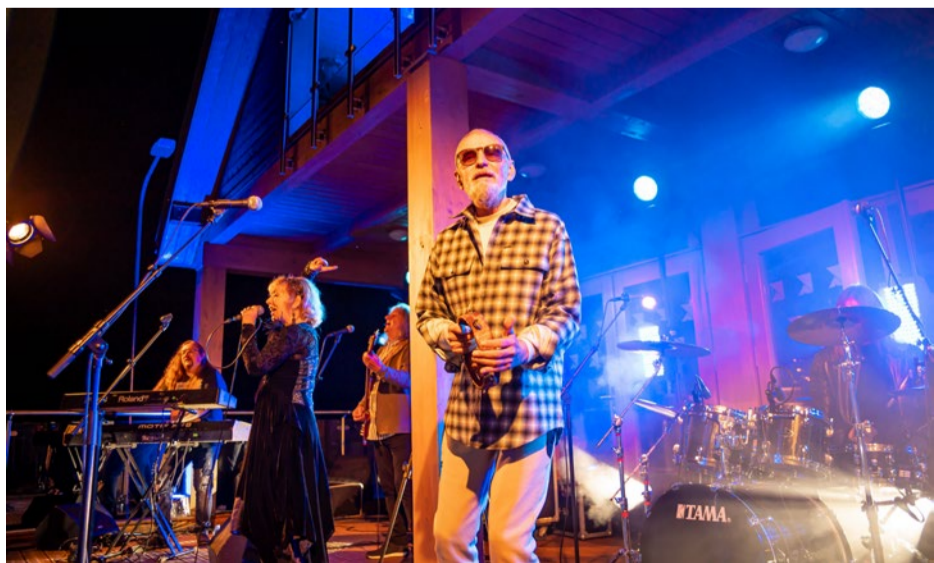
Legendārā grupa „Pērkons” uz Ķekavas novada Jaunu ideju centra terases.