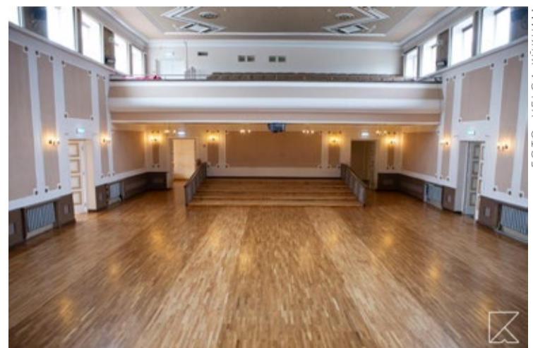
Atjaunotais parkets Baložu Kultūras nama Lielajā zālē.

Ir uzsākti arī Ķekavas Kultūras nama pirmā stāva vestibila remontdarbi, kuru laikā vestibils iegūs jaunu, modernu veidolu, kas būs ieturēts vienotā stilā ar