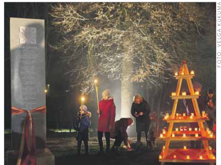
Atklājot piemiņas akmeni Lāčplēša Kara ordeņa kavalieriem.