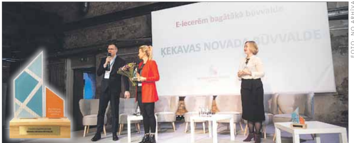
Ķekavas novada pašvaldības pārstāvji saņem balvu.

Būvniecības valsts kontroles birojs ir nodrošinājis pilnībā digitālu būvniecības procesa dokumentācijas apriti Būvniecības informācijas sistēmā, tādējādi Latvijai izvirzoties starp noza-