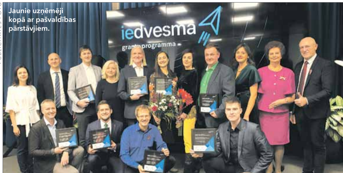
Jaunie uzņēmēji kopā ar pašvaldības pārstāvjiem.

Noslēdzoties „SEB bankas”, Jūrmalas pilsētas, Ķekavas, Mārupes, Olaines, Siguldas, Ropažu un Stopiņu novada kopīgi rīkotās grantu programmas jauno uzņēmēju atbalstam „(ie)dvesma” trešajai sezonai, izvēlētas astoņas perspektīvākās biznesa idejas. Kopumā biznesa ideju autori saņems 70 000 eiro to īstenošanai.