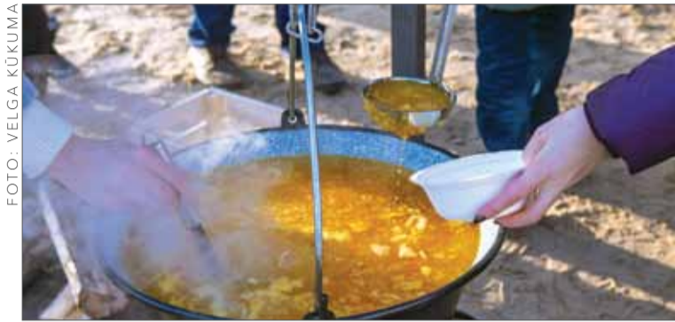
Sanākušie novadnieki pēc nelielās sportiskas iesildīšanās baudīja gardu zupu svaigā gaisā.