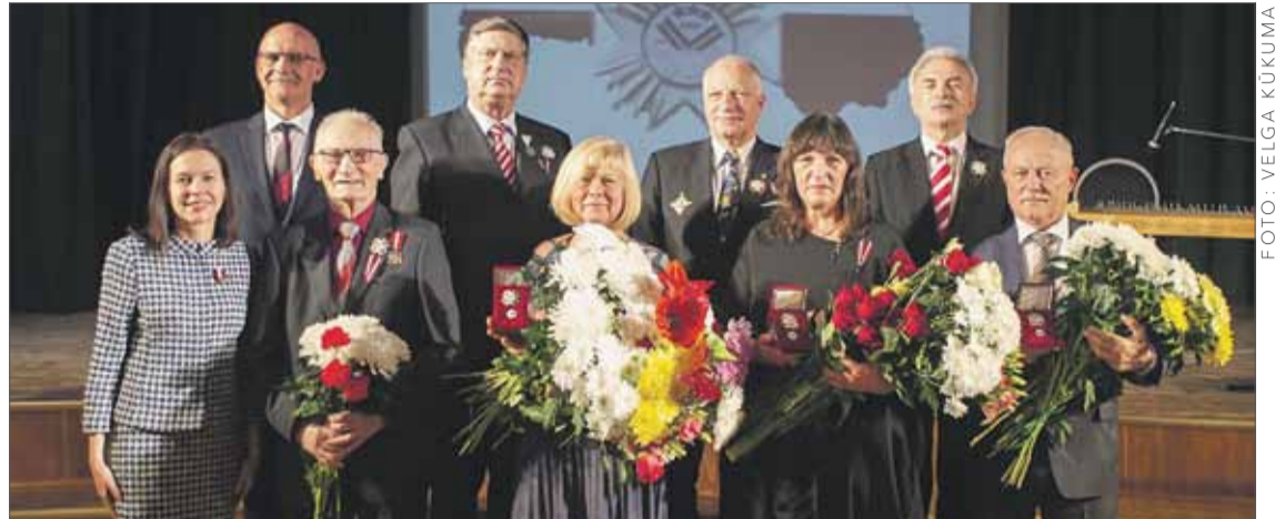
Mirklis no Lāčplēša Goda zīmes pasniegšanas pasākuma.

Gājiens noslēdzās ar piemiņas zīmes atklāšanu Lāčplēša Kara ordeņa* kavalieriem. Tā izveidota Latvijas simtgadei veltītā projekta „Atceries Lāčplēšus” ietvaros, pieminot tautas vēsturi un Latvijas varoņus – Lāčplēša Kara ordeņa kavalierus. Šā projekta laikā visā Latvijā tiek uzstādītas vienota parauga piemiņas zīmes Lāčplēša Kara ordeņa kavalieriem. Šā gada 11. novembrī tāda tika atklāta arī Ķekavas novadā.