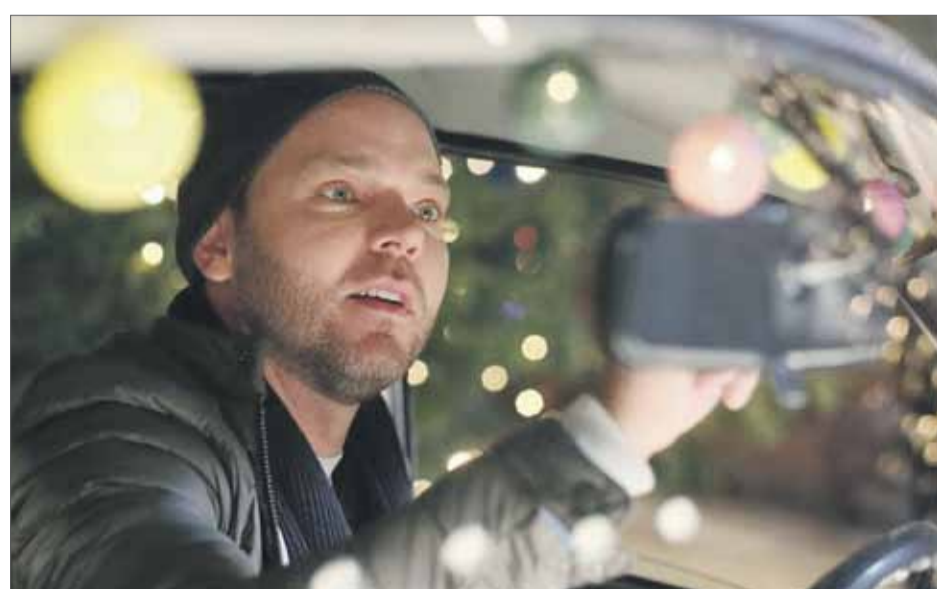
Kadrs no romantiskās komēdijas „Jaungada taksometrs 2”.

14. decembrī plkst. 15.00 Ķekavas senioriem veltīts koncerts „Lai zvaigznes mirdzums gaišs”. Dziedās vīru koris „Ķekava”. Lidzi ņemiet ielūgumus, lai saņemtu Ķekavas novada pašvaldības svētku dāvanu.