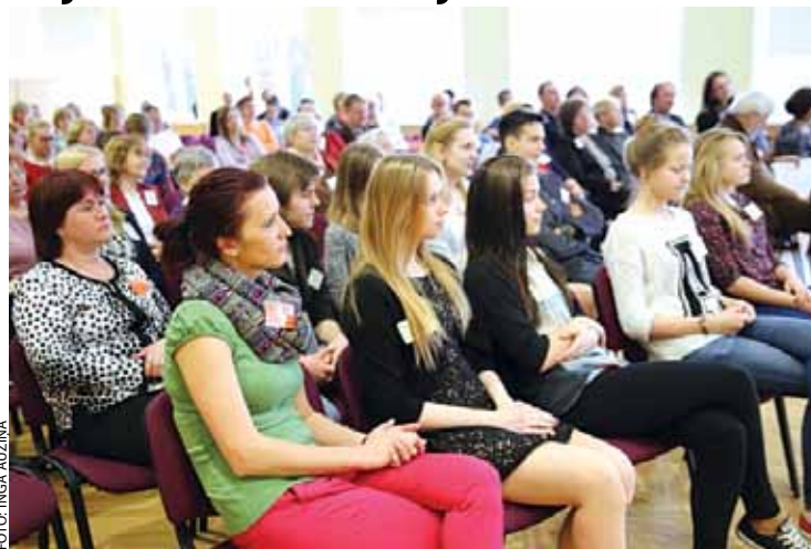
Forumā dalībnieki gatavoja diskusijām.

Pēc iedzīvotāju foruma rezultātu apkopojuma strādāsīm pie Ķekavas novada fonda izveides. Pārmaiņas mūsu sabiedrībā un jauni projekti pēc foruma lielā mērā būs atkarīgi no mums pašiem. Ja būs cilvēki, kuri gribēs idejas īstenot, risinājumu kopīgi ar Ķekavas novada fondu atradīsim.