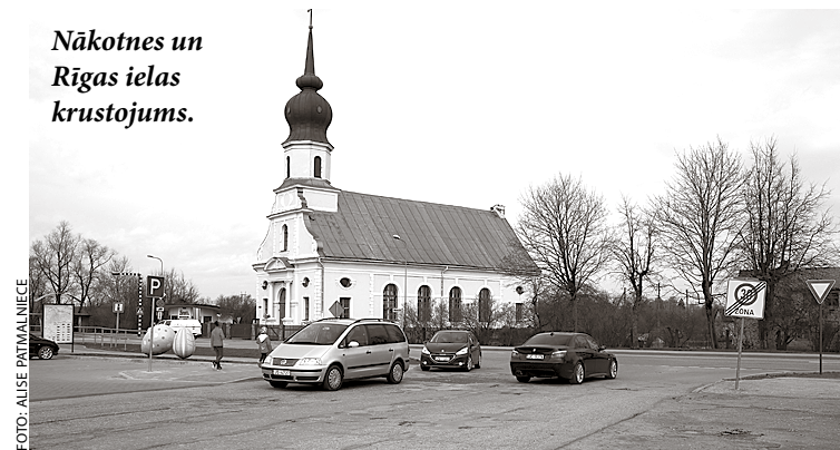
Nākotnes un Rīgas ielas krustojums.