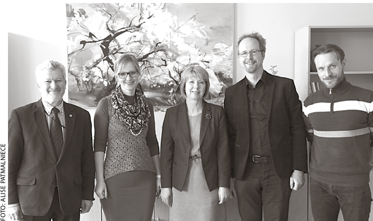
Viesojoties Ķekavas sākumskolā.

Gan skolas direktors, gan skolotājs pirmo reizi viesojās Latvijā. Skolas pārstāvjus savās ģimenēs uzņēma Ķekavas vidusskolas skolotāji. Vizītes laikā tika pārrunāta skolu turpmākā sadarbība, izglītības sistēma Latvijā, Hans-Brügemann skolas skolēnu un skolotāju vizīte Ķekavas vidusskolā, kas plānota no 16. līdz 22. maijam, kā arī Ķekavas vidusskolas skolēnu un skolotāju vizīte Bordesholmā šā gada jūnijā.