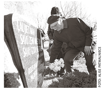
Noliekot ziedus pie piemiņas akmens Odukalnā.

Dzintra Geka stāstīja par to, kā top dokumentālās filmas par izsūtītajiem un viņu ģimenēm, ar kādām problēmām Krievijā jāsaskaras fil-