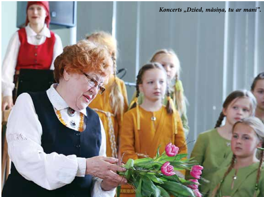
Koncerts „Dzied, māsiņa, tu ar mani”.