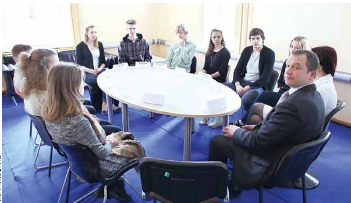
Jauniešu dome, tiekoties ar Ķekavas novada domes priekšsēdētāju.

1. aprīlī – dienā, kad visa pasaule jokoja uz nebēdu, – Jaunatnes iniciatīvu centrs plaši vēra durvis ikvienam, kurš vēlējās noskaidrot, kas īsti notiek JIC'ā, kā jaunieši to sauc, un ko paši jaunieši tur dara.