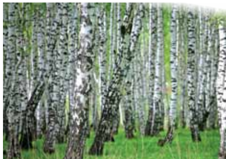
Kokapstrāde – viens no eksporta stūrakmeņiem

Ieteikumus eksporta uzsācējiem sniegs ne vien Latvijas uzņēmēji, bet arī citu valstu