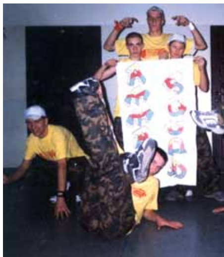
Ielu dejojāji no Polijas