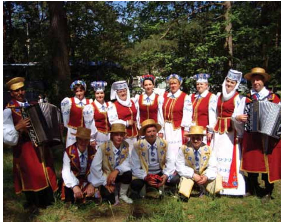
Kolektīvs Na panadvorku ir Baltkrievijas tautas ansamblis

Folkloras kopa no Setumaa , Obinitsa – senās setu kultūras glabātāja un kopēja. Senās setu teikas, ticējumi un dziļa ticība raktsturo setu tautas kultūras dziļumu