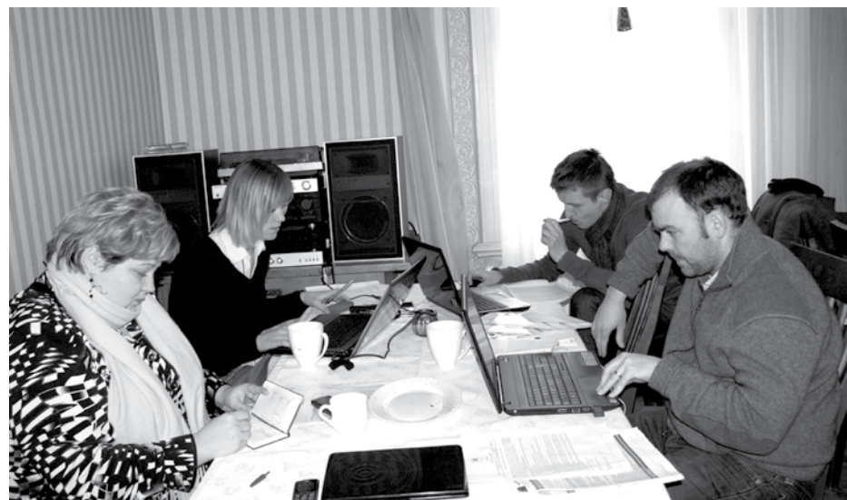
Projekta sagatavošanas process Rāmas muižā