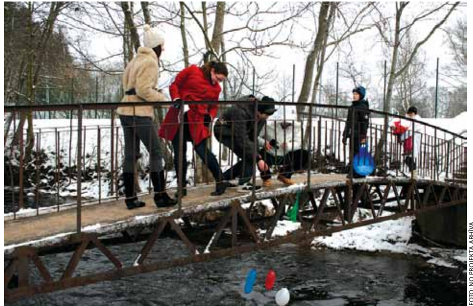
Projekta ietvaros katrā tikšanās reizē jauniešiem norit saliedēšanās aktivitātes Dārgumu meklēšana.

Jaunieši ir apņēmības pilni visas šīs trīs idejas realizēt un parādīt Ķekavas iedzīvotājiem, ka Ķekavā pasākumi jauniešiem var būt interesanti, jaukti, atraktīvi un baudāmi. Protams, milzīgs darbs vēl