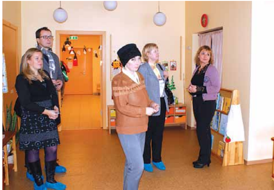
Aplūkojot bērnudārza Bitīte telpas

25. janvārī Ķekavas novada pirmsskolas izglītības iestādē Bitīte Katlakalnā viesojās Garkalnes novada pašvaldības pārstāvji, lai iepazītos ar bērnudārza tel-