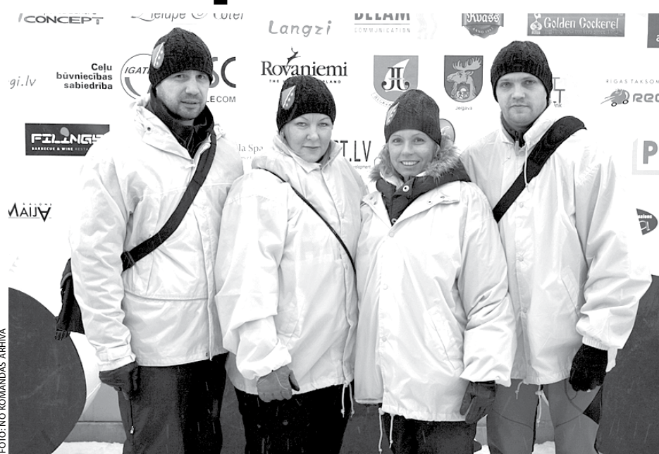
Ķekavas novada komanda 8. Pasaulē čempionātā ziemas peldēšanā