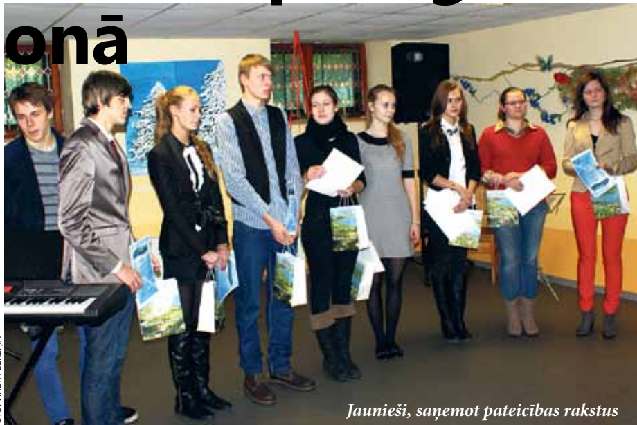
Jaunieši, saņemot pateicības rakstus