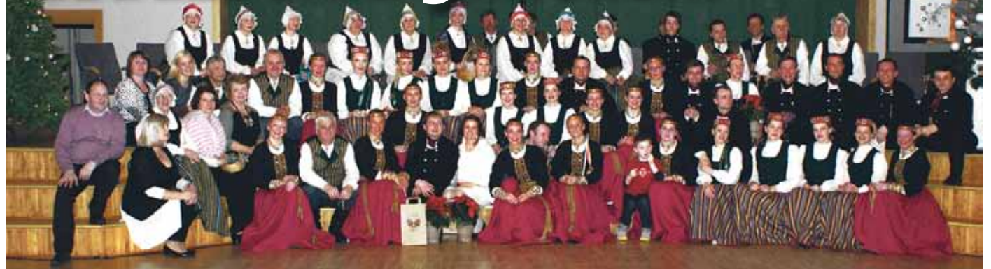
Labdarības koncertu ģimenēm veltīja deju kolektīvi Zile un Sidrabaine.