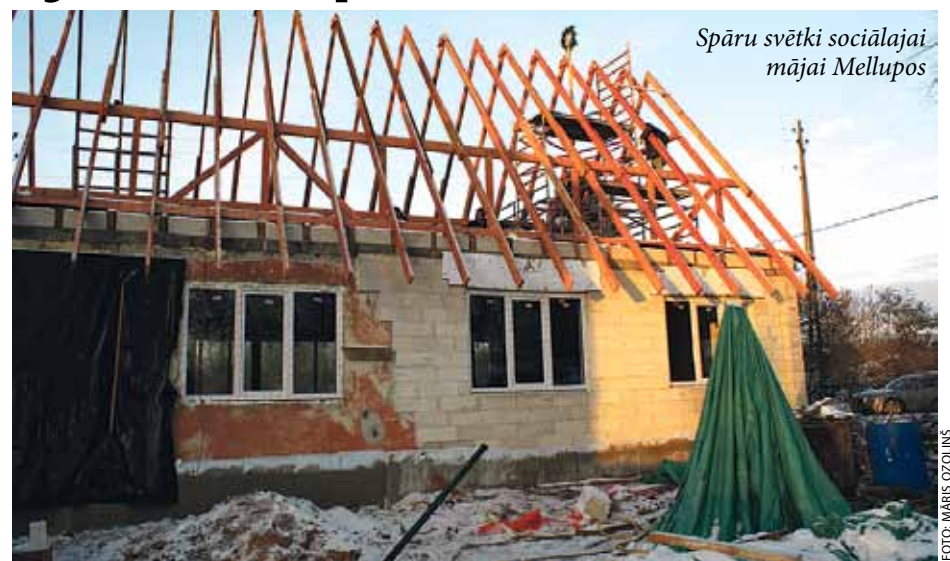
Spāru svētki sociālajai mājai Mellupos