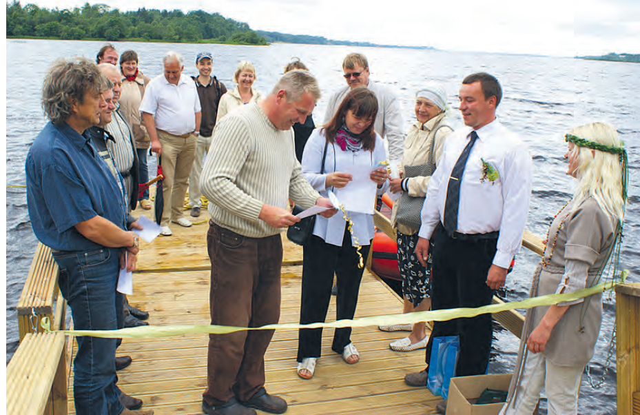
Atklājot pirmo publisko pontonu laivu piestātne Ķekavas novadā