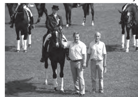
Bronzas medaļa jātnieku sportā