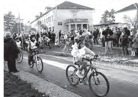
Baložos izbūvēts veloceliņš.