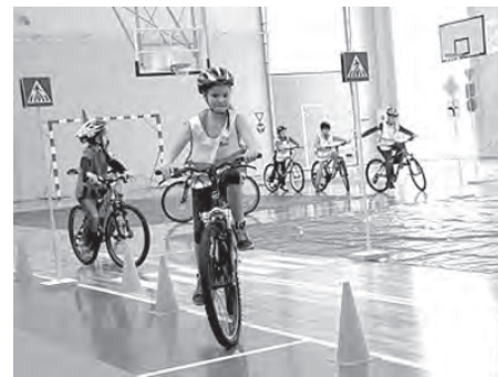
Jaunā sporta zāle Baložu vidusskolā