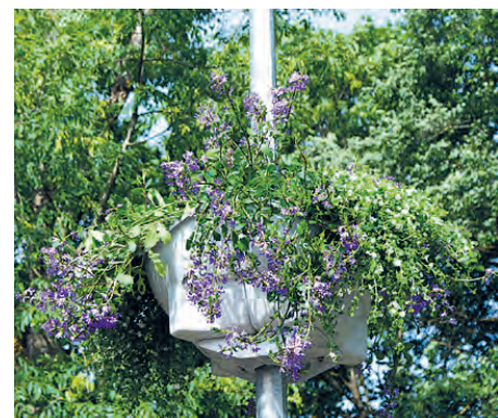
Skaistumam un priekam – pie apgaismes stabiem piestiprināti puķu podi.

Renovācijas laikā estrādei tika nomainīta skatuves grīda, izveidojot tai vienlaidus betona klājumu, skatītāju solu virsmas, nokrāsots skatuves jumts un pieslēgts teritorijas apgaismojums, kā arī labiekārtota estrādes apkārtnē.