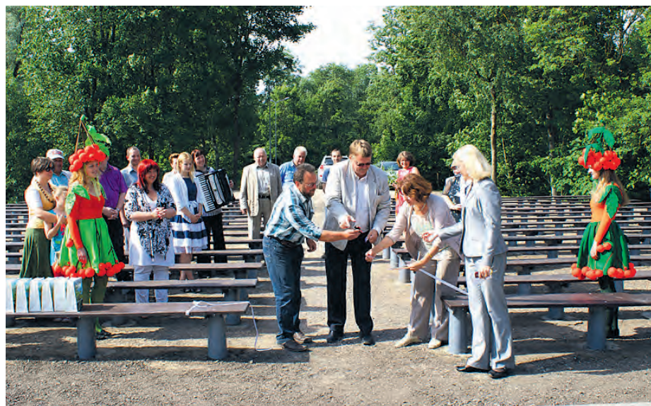
Atklājot atjaunoto Dzirnavu estrādi

iedzīvotāju patīkamai brīvā laika pavadīšanai Ķekavas novada pašvaldība izremontējusi Dzirnavu estrādi Ķekavā, kas nesen nonākusi pašvaldības īpašumā .