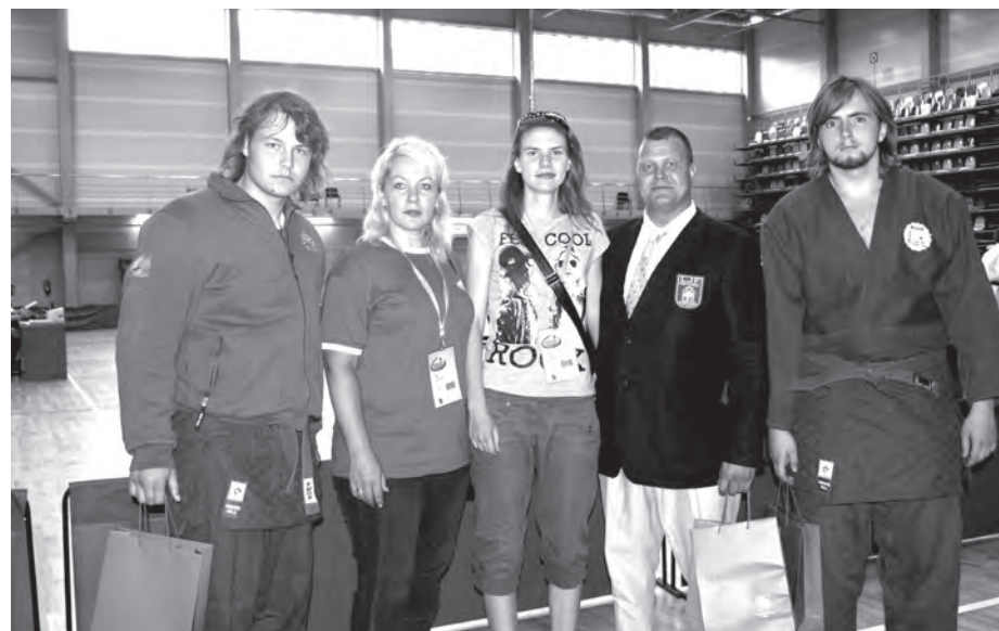
Bronzas medaļa džudo

No 6. līdz 8. jūlijam Liepājā Latvijas III Olimpiādē Ķekavas novada sportisti izcīnīja sešas olimpiskās medaļas. Sudraba medaļa – vīriešu komandai regbijā un piecas bronzas medaļas – jātnieku sportā, sporta vingrošanā un džudo.