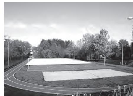
Stadions pie Ķekavas sākumskolas