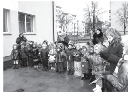
Baložos nosiltināts bērnu rotaļu laukums.