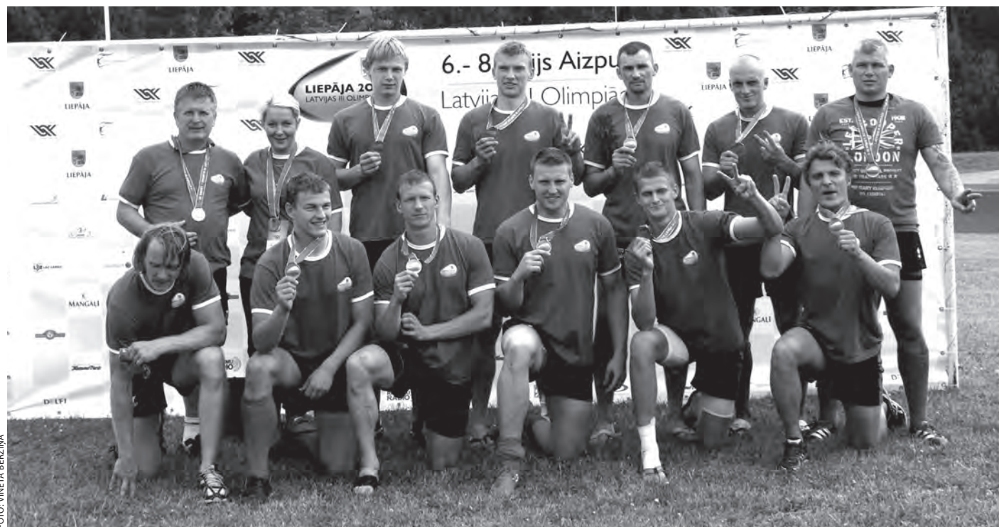
Vīriešu komandai regbijā tiek sudraba medaļa.