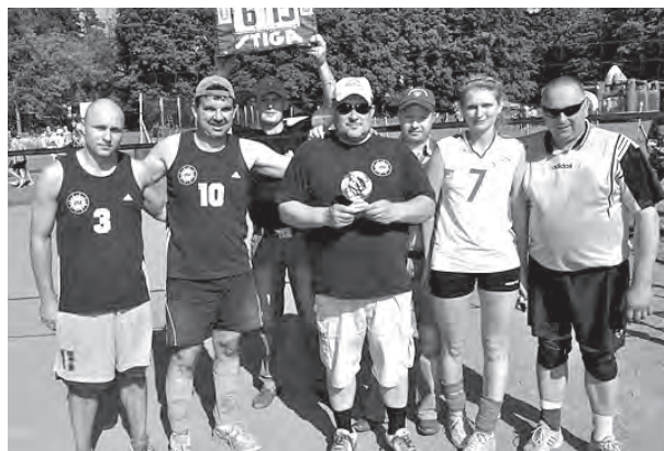
Valsts policijas Rīgas reģiona Baložu iecirkņa komandas pārstāvji

IeM sporta spēlēs Kandavā šogad piedalījās kopumā apmēram 1000 sportistu no Valsts policijas, Valsts ugunsdzēsības un glābšanas dienesta, Pilsonības un migrācijas lietu pārvaldes, Valsts robežsardzes, Drošības policijas, Rīgas paš-