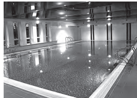
Daugmales sporta un kultūras centrs