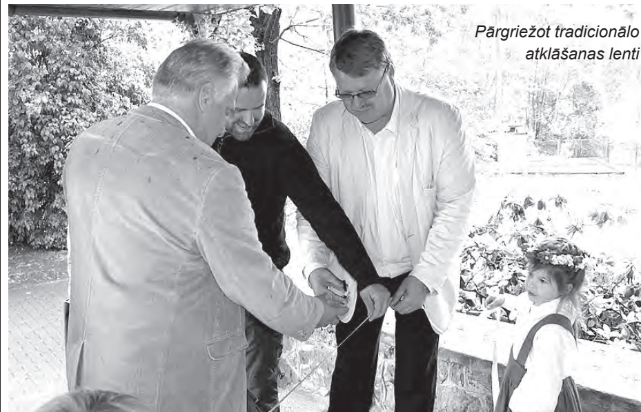
Pārgriežot tradicionālo atklāšanas lenti

11. jūnijā svinīgi tika atklāta uzstādītā saules kolektora sistēma Ķekavas novada pirmsskolas izglītības iestādē leviņa , kas turpmāk ar saules enerģiju uzsildīs bērnu dārza peldbaseina ūdeni. Iegūto siltumu daļēji izmantos arī apkurei.