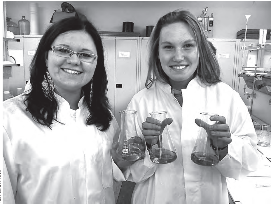
Ķekavas vidusskolas jaunieši Bordesholmā pēta ūdens kvalitāti.