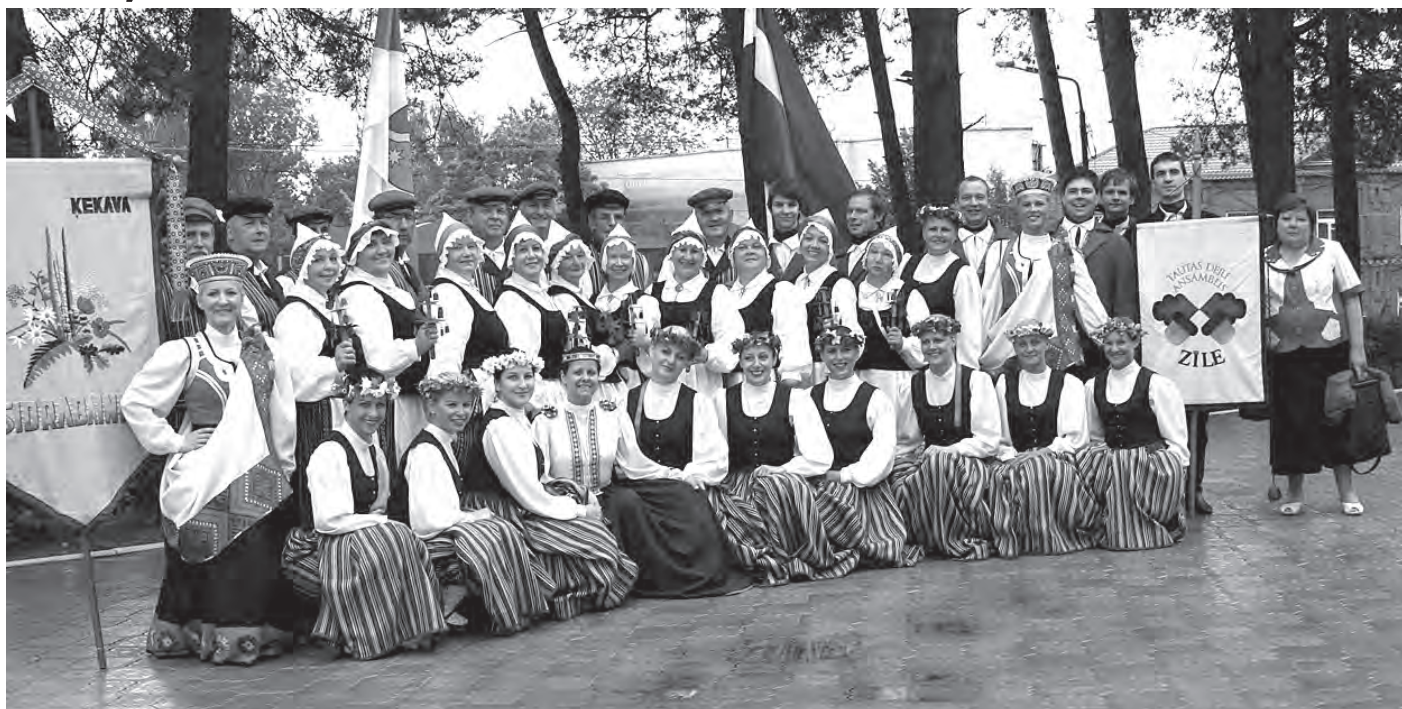
Tautas deju ansamblis Zile un senioru deju kolektīvs Sidrabaine Baltkrievijā

Nedēļu pirms Latvijas pakalnos skatnēja Līgo dziesmas, tautas deju ansamblis Zile un senioru deju kolektīvs Sidrabaine viesojās starptautiskajā festivālā Baltkrievijā, Braslavā.