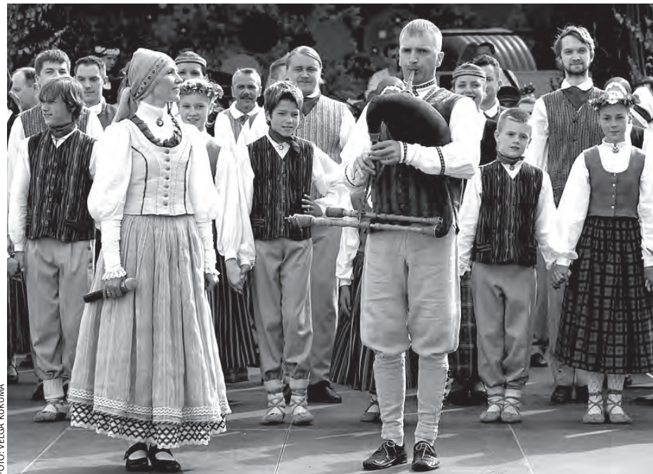
Koncerts Latviešu tautas deju karaliene – polka

Pasākuma vakara daļa sākās ar rokkoncertu