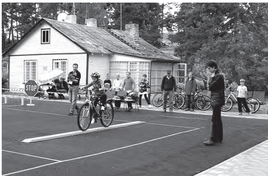
Sacensības Klapkalnciema Ronīšos

Baložu vidusskolas komanda jau septīto gadu ar uzvaru pirmajā posmā izcīnā tiesības pārstāvēt Pierīgu un tagad jau Ķekavas novadu lielajā finālā. Fināla sacensību galvenā arēna ir RTU Sporta un atpūtas bāze Ronīši . Šogad sacensību nolikums noteica teorētiskos pārbaudījumus, kuros tika ietvertas tēmas par ceļu satiksmes noteikumiem, pirmās palīdzības sniegšanu un ceļu satiksmes drošību, un praktisko velosipēdu vadīšanu šķēršļu joslās 12 stacijās divu dienu garumā. Forumā dalībniekiem papildu grūtības sagādāja brāzmainais lietus, jo šķēršļi, zāle un segums kļuva slideni. Tomēr mēs kā organizatori esam patīkami pārsteigti par dalībnieku spēju koncentrēties un uzrādīt ļoti labus rezultātus arī ekstremālos apstākļos."