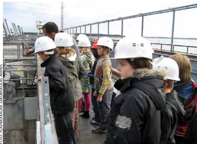
Kā balvu Ķekavas novada pašvaldības konkursā Mūsu dzīves telpa Ķekavas novadā pēc ... gadiem ieguva ekskursiju uz Rīgas HES.

Mūsu skolas kolektīvam ir vairāki nākotnes plāni un sapņi, bet kā galvenos vēlētos minēt šos: uzsākt īstenot pamatizglītības programmu līdz 6. klasei ar valodu novirzienu, iekārtot un sertificēt medicīnisko kabinetu, lai skolā uz vietas būtu medmāsa.