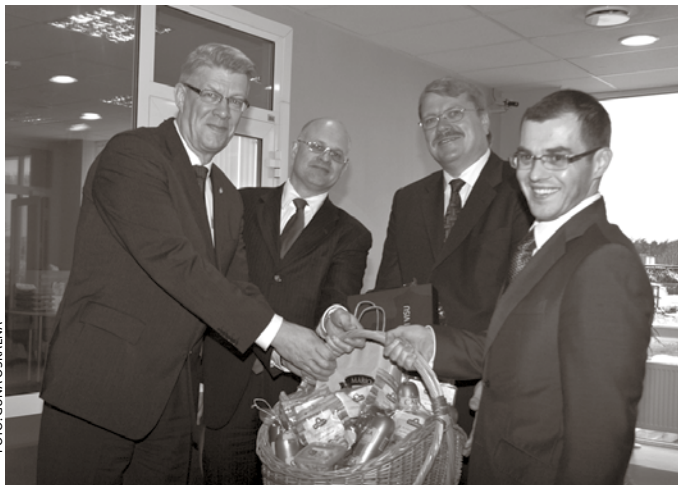
Valsts prezidents saņem novada veltes

Bet vizītes noslēgumā Valsts prezidents tikās ar vairāk nekā 20 novada uzņēmējiem Putnu fabrikā Ķekava , lai pārrunātu problēmas un iespējamās risinājumus uzņēmējdarbības attīstībā. Tika pārrunātas tādas tēmas kā, piemēram, ņemot vērā graudaugu cenu milzīgās svārstības, jāveido graudu uzkrājums, lai spētu veiksmīgāk variēt ar produkcijas cenu, un nepieciešamība pēc skaidra valsts tautsaimniecības attīstības plāna tuvākajiem pāris gadiem.