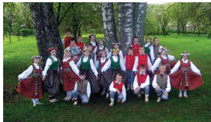
Pļavniekkalna sākumskolas deju kolektīvs Pie Daugavas

Liels paldies skolas pedagogiem par ieguldīto darbu skolēnu izglītošanā un audzināšanā!