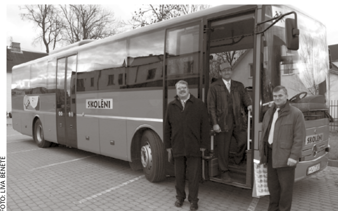
Ķekavas novada pašvaldības pārstāvji, saņemot jauno autobusu skolēnu pārvadāšanai.