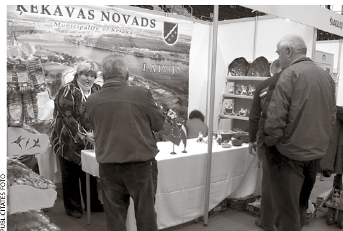
Ķekavas novada pašvaldības stends izstādē izraisīja lielu apmeklētāju interesi.

Izstādē Šauļi 2010 piedalījās gan Lietuvas, gan citu ārvalstu, piemēram, Francijas, Polijas pašvaldības, tūrisma informācijas centri, uzņēmēji un to nozaru organizācijas. Šauļu