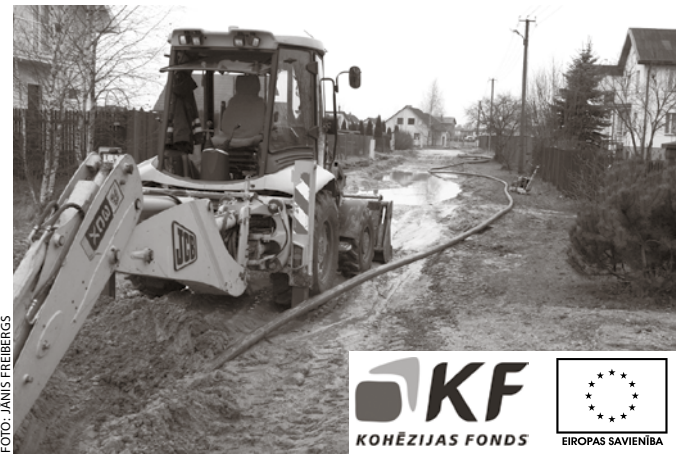
Katlakalnā, Asteru ielā jau pilnā sparā rit būvdarbi.

Projekta kopējās izmaksas ir vairāk nekā trīs miljoni latu, no tiem 95% finansējuma