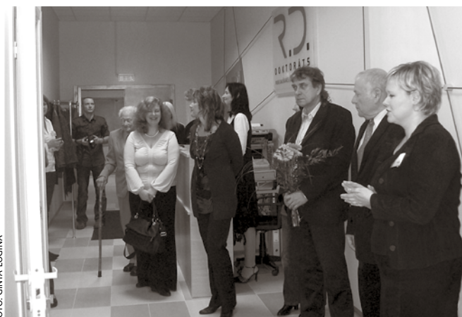
Novada iedzīvotājiem paplašinājies ģimenes ārstu pakalpojumu klāsts.