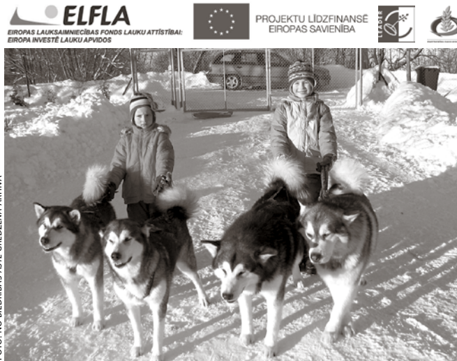
Bērni kopā ar biedrības Aste gredzenā mīļajiem kompanjoniem gatavi doties sniegainā izbraukumā.

Projekta Vienoti ar dabu atpūtā un sportā iesniedzējs ir biedrība Aste gredzenā . Tā mērķis – radīt materiāli tehnisko bāzi un apstākļus veselīgai brīvā laika pavadīšanai kopā ar ģimeni,