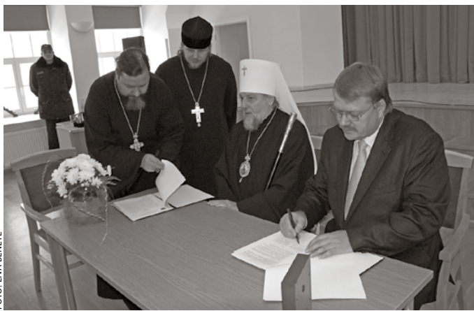
Tiek parakstīts līgums par zemes gabala nomu pirmā pareizticīgā dievnama būvniecībai Baložos.

Lai nodrošinātu sabiedrības līdzdalību, lemjot par īpaši svarīgiem vietējās nozīmes jautājumiem, Ķekavas novada Dome rīkoja publisko apspriešanu, aicinot iedzīvotājus izteikt savu