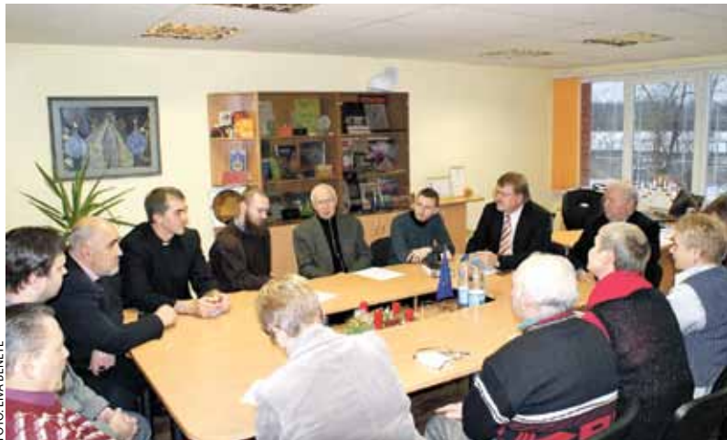
Pirmo reizi novadā Domē kopīgi tikās novada visu reliģisko konfesiju pārstāvji.

Klātesošie apsprieda nākotnes sadarbības iespējas, izveidojot sabiedriski reliģisko konsultatīvo padomi un īstenojot kopīgus pasākumus, piemēram, ekumeniskos dievkalpojumus ar visu novada reliģisko konfesiju mācītāju dalību un Krusta ceļa gājieni Lieldienās. Tāpat pašvaldības un draudzes pārstāvji diskutēja par labdarības un