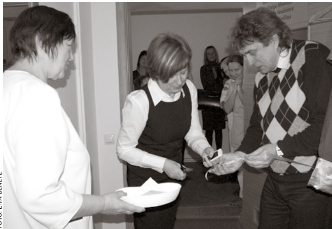
Atklājot jaunās Ķekavas ambulance telpas, svinīgi tiek pārgriezta lenta.