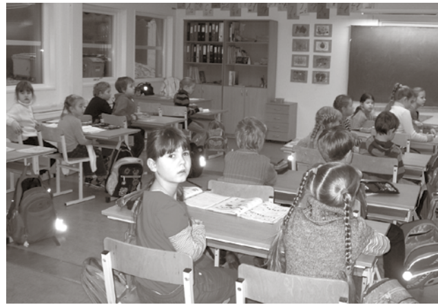
Skolēni un viņu vecāki atzinīgi novērtē moduļa priekšrocības.