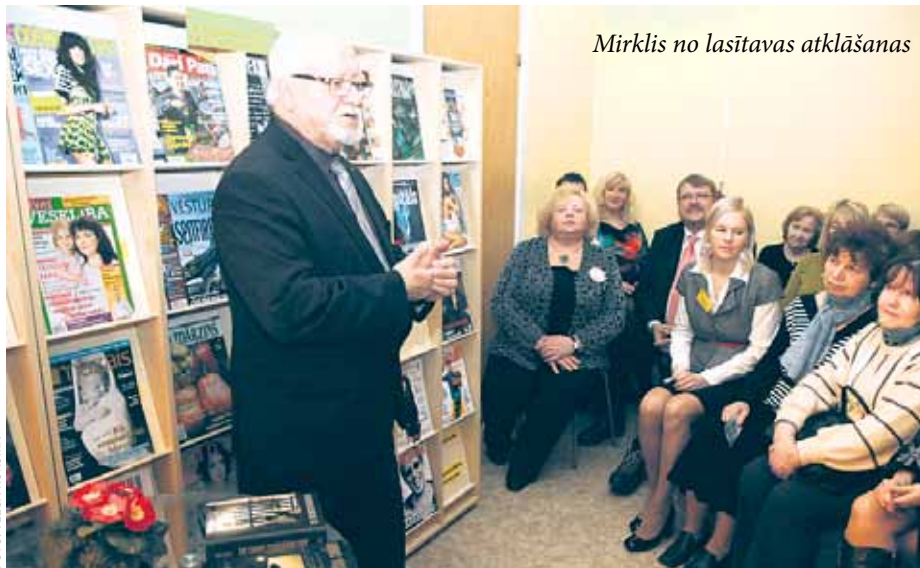
Mirklis no lasītavas atklāšanas

Bet nu atpakaļ pie notikuma... Pēc tam, kad lasītavā viesi bija draudzīgi sasēdu-