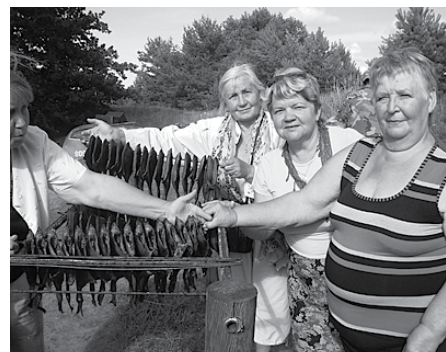
Cepot sklanda raušus un izgaršojot zivis