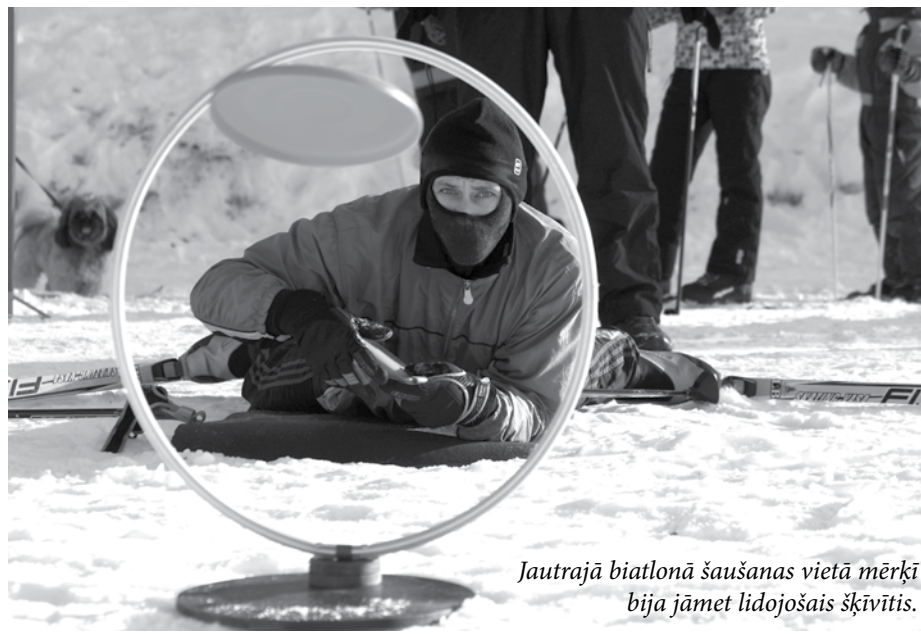
Jautrajā biatlonā šaušanas vietā mērķi bija jāmet lidojošais šķīvītis.

sību dalībniekus un līdzjutējus. Sacensību dalībniekiem bija iespēja izmēģināt spēkus jautrajā biatlonā , kur šaušanas vietā mērķi ir jāmet lidojošais šķīvītis. Savukārt tie, kam slēpes vēl isti neklausā, varēja piedalīties ragaviņu vilkšanas sacensībās!