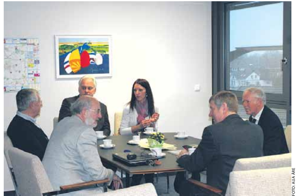
Ķekavas novada pašvaldības delegācijas tikšanās ar Rotary pārstāvjiem Bordesholmā

Rotary kluba pārstāvji atzina, ka latviešu jaunieši ir paveikuši lielu darbu un