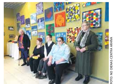
Dienas centra jubilejas izstādes atklāšana

Par godu dienas centra trešajai gadskārtai 1. februārī Ķekavas sociālās aprūpes centra zālē uzstājās Baložu linijdejtāju kluba Jautrie zābacīni dejotāji. Kolektīvs jau trešo reizi ieguvis Pasaules čempionu titulu linijdejās, tāpēc skatītāji vēroja priekšnesumu ar īpašu interesi un atsau-