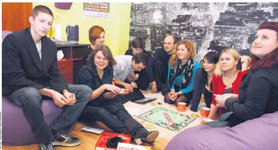
No ĶNKA jauniešu centra atklāšanas pasākuma

Kopš 2012. gada maija aktīvu jauniešu pulciņš īsteno projektu The taste of democracy jeb Izgaršo demokrātiju, ko finansē programma Jaunatne darbībā . Projekta ideju radīja jaunieši, pateicoties iepriekš veiktajiem starptautiskiem un vietēja mēroga jauniešu projektiem.